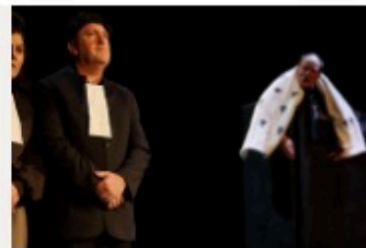
La Lionne, Gisèle Halimi