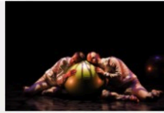
Le K Outchou