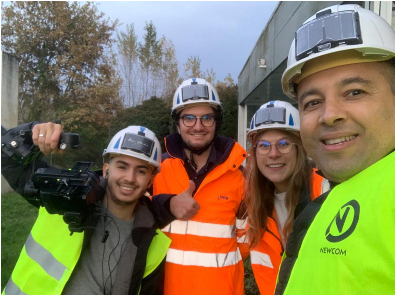
Une partie de l'équipe de New com lors d'un tournage.

la qualité du travail bien fait, des délais... »