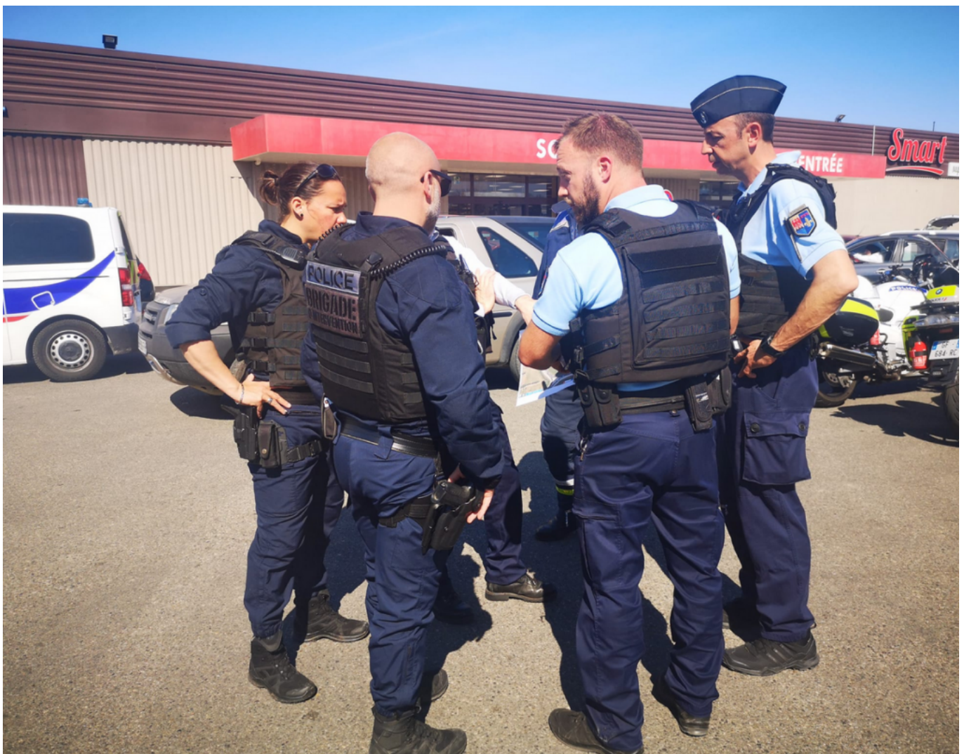
Brigade d'intervention

Un escadron de gendarmerie mobile (EGM) est actuellement déployé à Avignon, notamment dans les quartiers de Monclar, de la Reine Jeanne et de Saint Jean ; à Carpentras, dans le quartier des Amandiers et à Cavaillon, à la Cité du Docteur Ayme. Des effectifs de cet EGM interviendront à Sorgues avec, pour mission, de garantir la sécurité, prévenir la délinquance, lutter contre le trafic de stupéfiants, sur l'ensemble du Vaucluse.