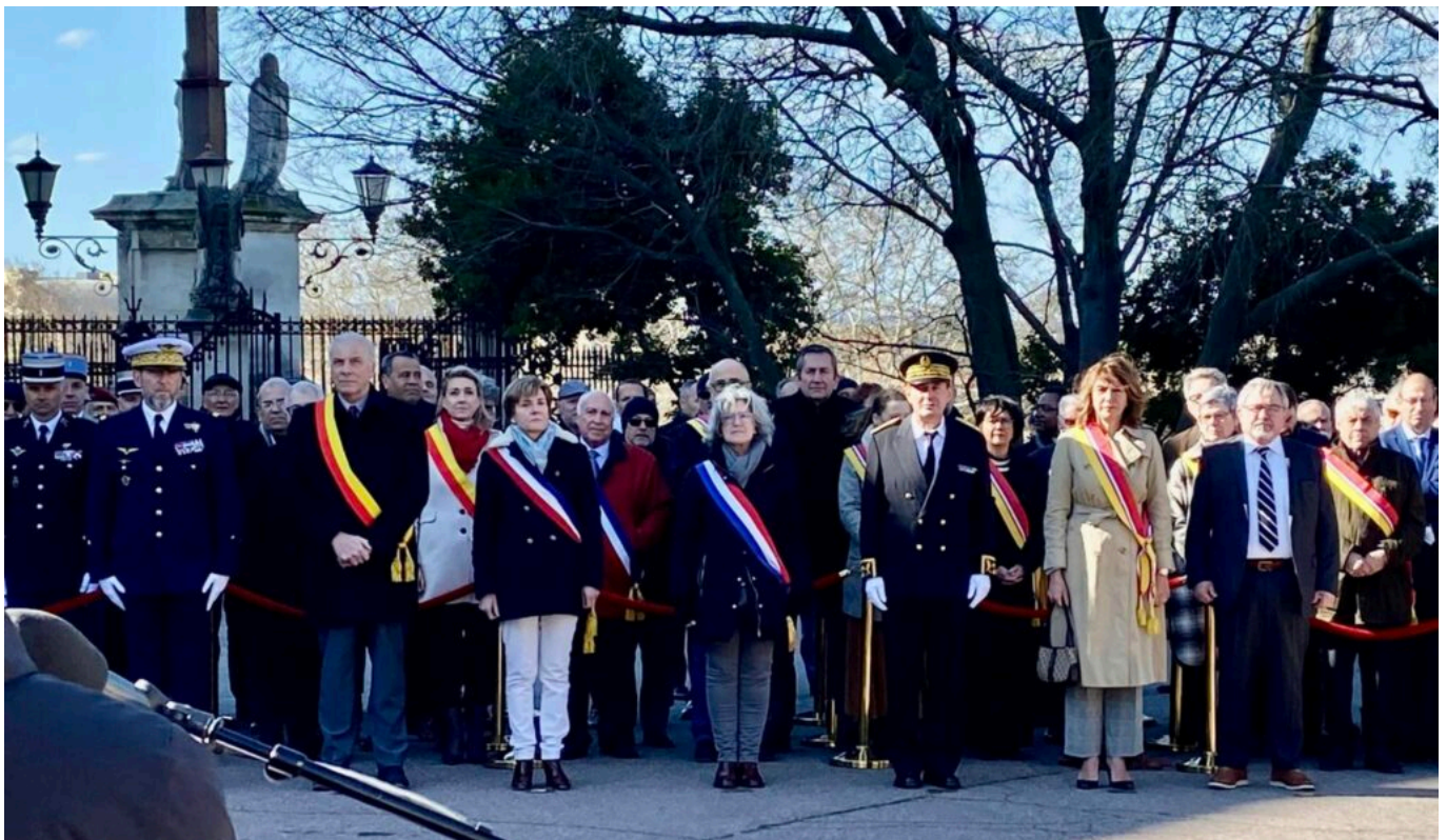
Le nouveau préfet avec les élus de Vaucluse ainsi que les représentants des services de l'Etat.

« Je suis touché par votre accueil, vous avez pris la peine de venir à notre première rencontre, a expliqué Thierry Suquet pour ses premiers pas en Vaucluse. C'est un plaisir d'avoir été nommé ici, cela prouve la confiance du président de la République et du ministre de l'Intérieur et des Outre-mer. C'est à la fois un honneur et une responsabilité. »