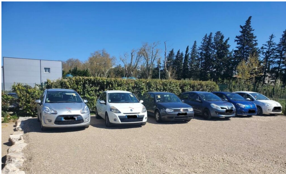
Les six véhicules saisis.

Présentés en comparution immédiate devant le tribunal judiciaire de Tarascon, les trois principaux organisateurs ont été placés en détention provisoire dans l'attente de leur jugement. Les cinq autres mis en cause ont été directement convoqués en justice par officier de police judiciaire pour répondre de faits de trafic de stupéfiants, de contrefaçon et de blanchiment d'argent.