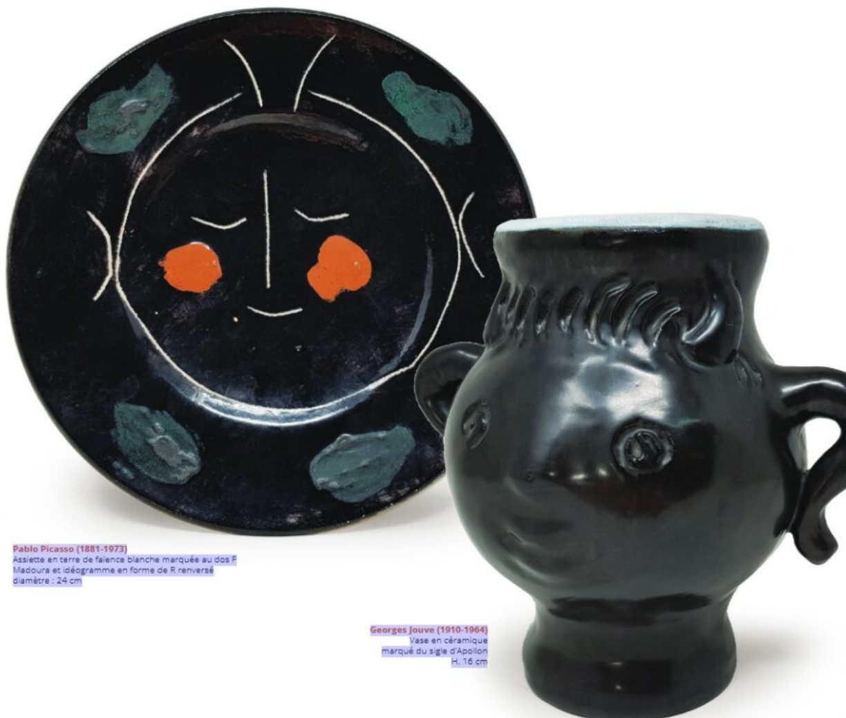
Pablo Picasso (1881-1973) Assiette en terre de faïence blanche marquée au dos F Madoura et idéogramme en forme de R renversé diamètre : 24 cm

En décembre : Les timbres et cartes postales jeudi 1 er ; Les Dinky toys et jouets anciens mercredi 7 et les bijoux vendredi 9.