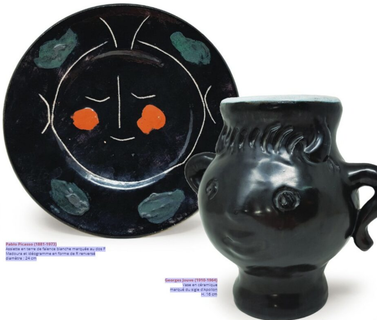
Pablo Picasso (1881-1973) Assiette en terre de faïence blanche marquée au dos F Madoura et idéogramme en forme de R renversé diamètre : 24 cm

En décembre : Les timbres et cartes postales jeudi 1 er ; Les Dinky toys et jouets anciens mercredi 7 et les bijoux vendredi 9.