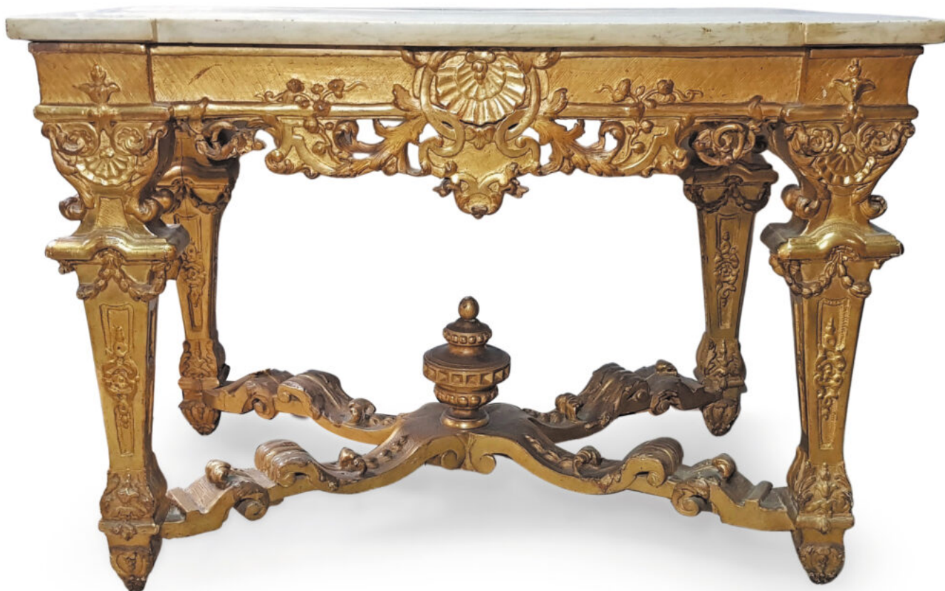
Table console en bois sculpté et doré - époque Régence - H. 77 x L. 112 x P. 65 cm - Estimation : 5000 / 8000 €

Vente le 24 novembre à 9h puis 14h, 21 rue de l'Agau, Nîmes, exposition préalable le 23 novembre de 10h à 17h.