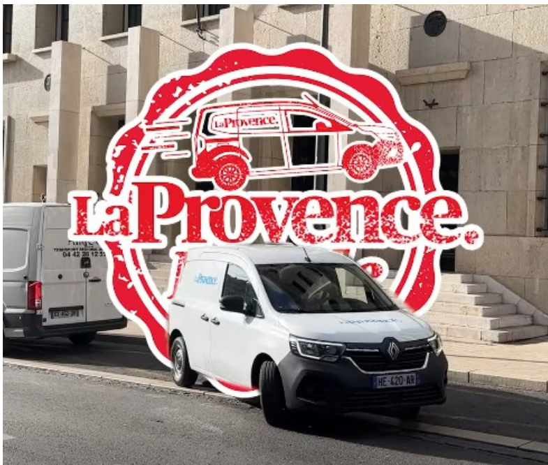
La Provence Mobile.

« Au-delà des équipes de journalistes sur le terrain, il y avait une très forte demande de remailler le territoire avec des interlocuteurs de La Provence, précise le directeur de la rédaction. Avec nos nouveaux correspondants, cela permettra également que de nombreuses communes ainsi que de nombreuses thématiques soient abordées dans nos colonnes. »