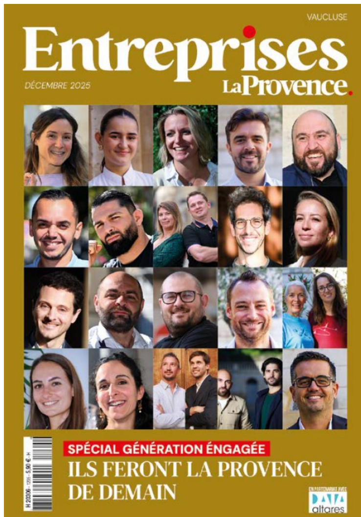
Photo : Les Lauréats vauclusiens de la 'génération engagée' »

En plus de la cérémonie des 30e Trophées de l'économie, La Provence a sorti un hors-série spécial de 154 pages.