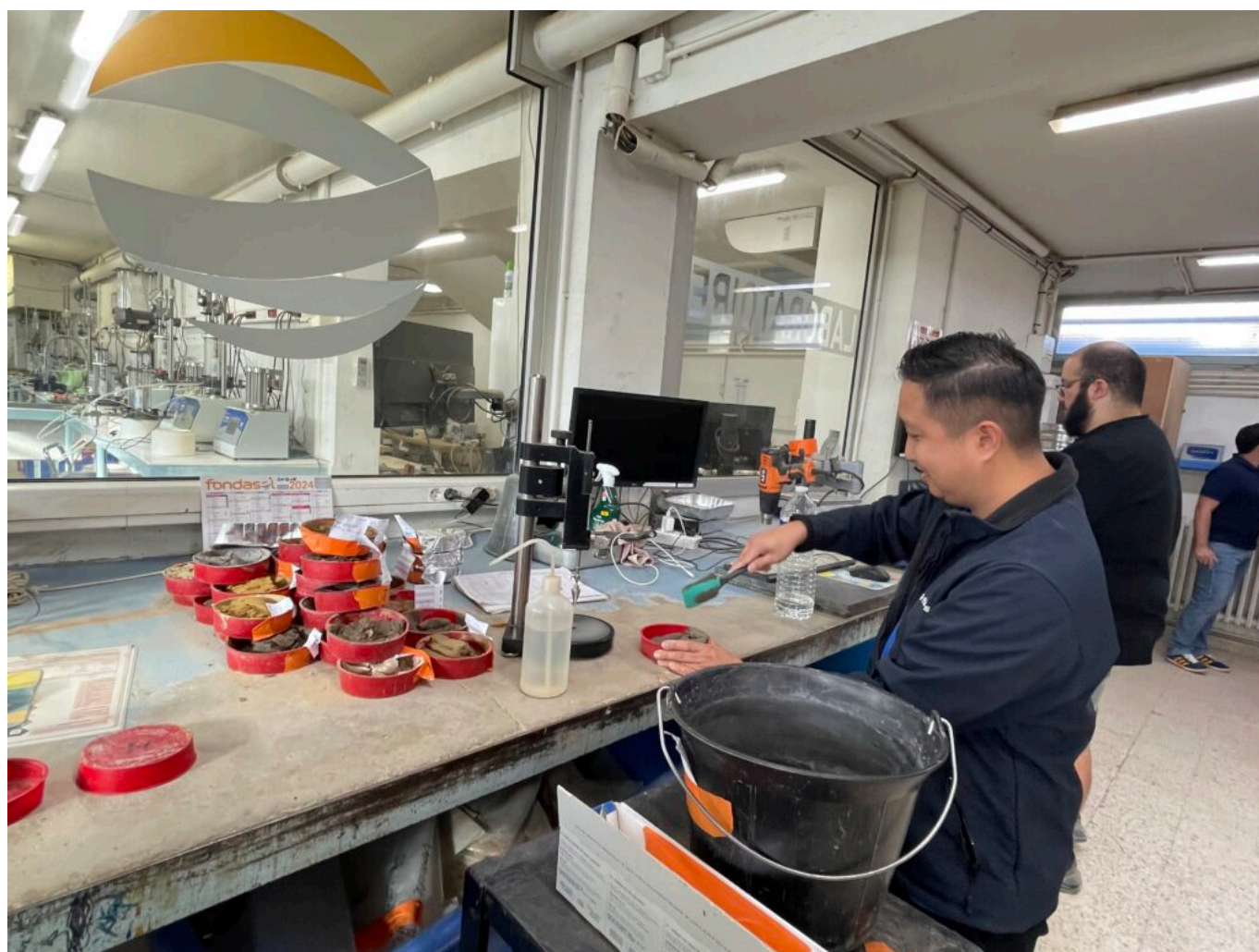
Analyses et travaux sur les échantillons