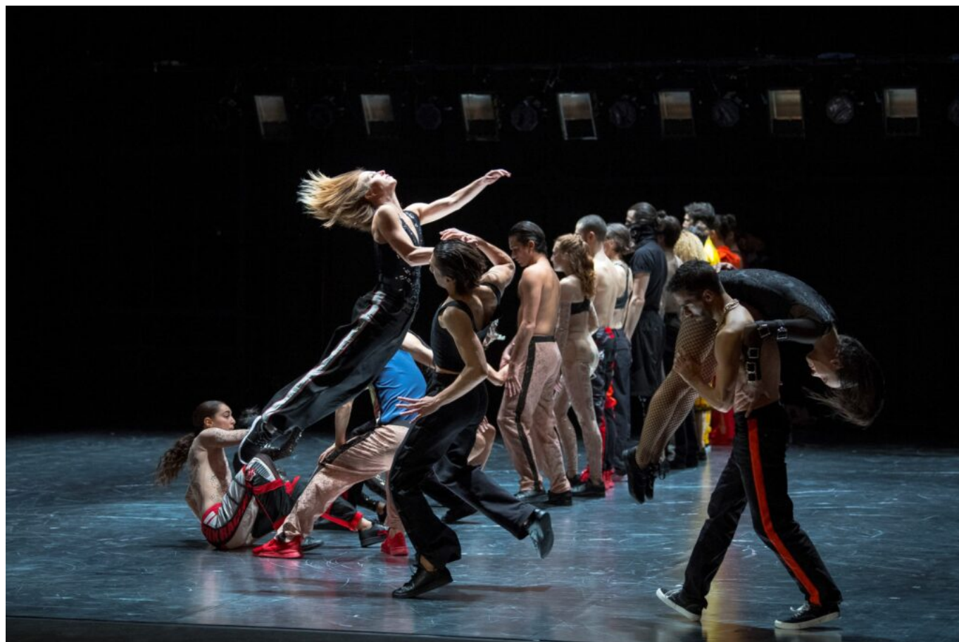
Static-Shot Copyright Laurent-Philippe

Vendredi 15 décembre. 20h. 5 à 30€. Opéra Grand Avignon. 4 Rue Racine. Avignon. 04 90 14 26 40. www.operagrandavignon.fr