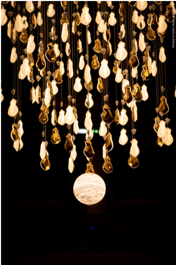
Le nouveau lustre de l'opéra du Grand Avignon comprend 626 pampilles en porcelaine de Limoges.