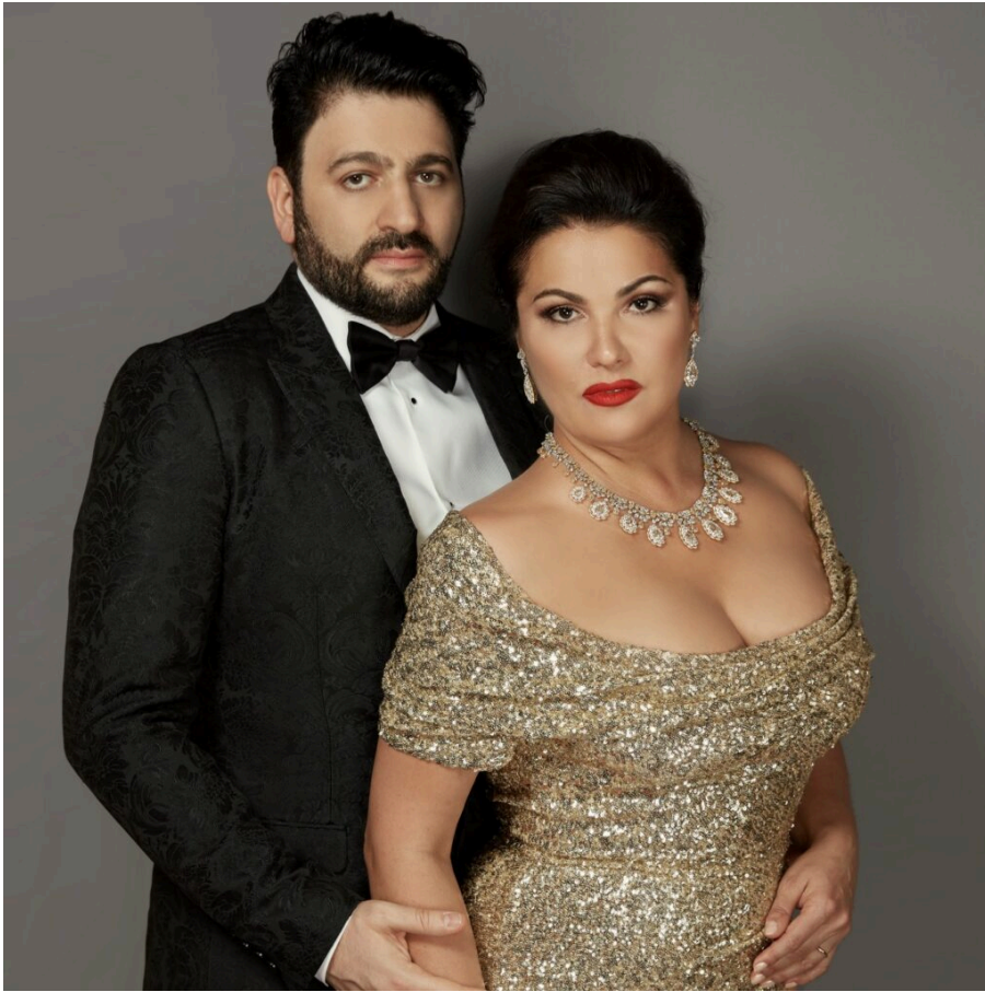
Anna Netrebko et son époux le ténor Yusif Eyvazov.

Enfin les Chorégies souhaitent accueillir des jeunes, c'est la raison pour laquelle, le directeur avec le conseil d'administration soutient des musiciens émergents, ce sera le cas le 13 juillet au Théâtre des Princes. « Allez les voir, les découvrir, ils sont formidables. En ce moment avec la crise tout court et la pandémie, les engagements sont rares, donnez-leur un coup de main ».