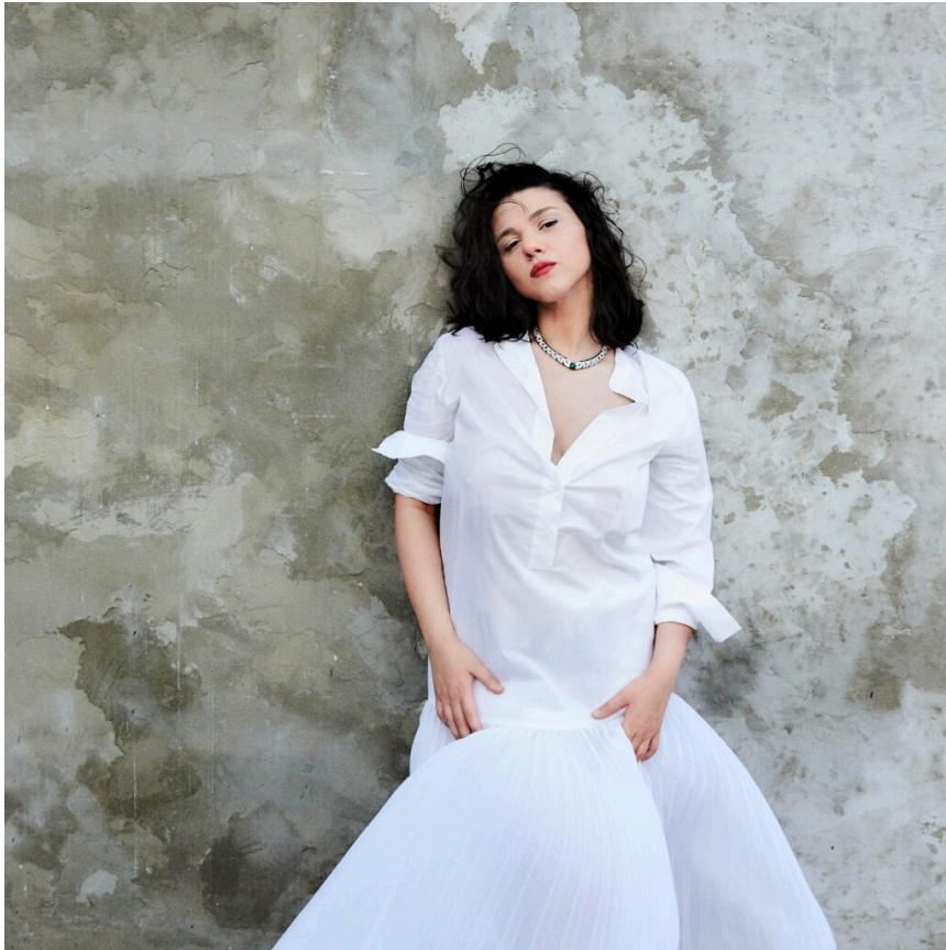
Khatia Buniatishvili.

parcourt la planète pour une carrière internationale et elle viendra pour la 1ère fois aux Chorégies interpréter l'émouvant Concerto pour piano n° 23 de Mozart.