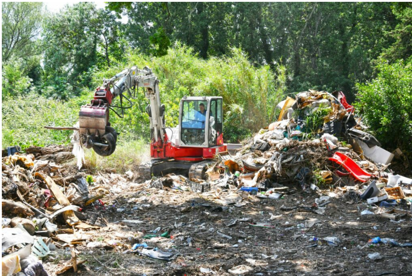
Nettoyage chemin de Baigne-Pied le 12 juin