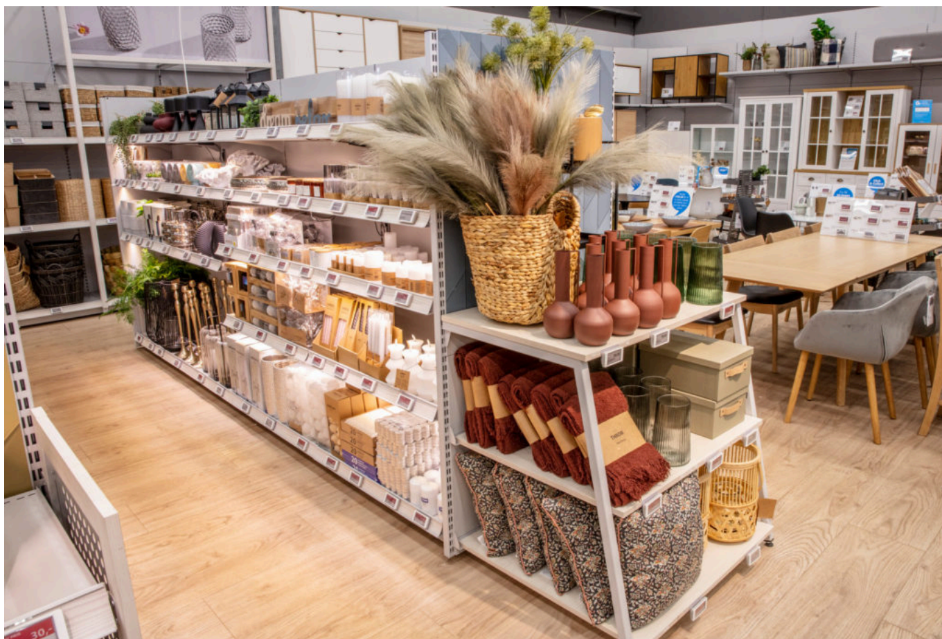
JYSK ouvre son 51ème magasin à Orange les Vignes.