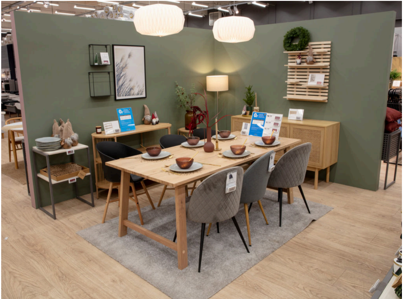
JYSK ouvre son 51ème magasin à Orange les Vignes.

Plus d'informations sur le magasin, cliquez ici . Actualités du centre commercial, cliquez ici .