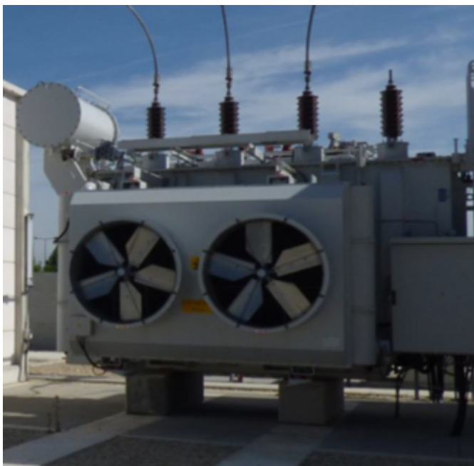
Un des deux transformateurs rénovés

Deux transformateurs de puissance 36 MW ont été rénovés dans le poste source afin d'alimenter les 12 lignes moyenne tension (départs) et d'assurer la continuité de service. Des moyens particuliers ont été mis en œuvre pour assurer une bonne intégration de l'ouvrage dans son environnement. Un des transformateurs, « géant de métal » de 40 tonnes et de 4 mètres de hauteur, se trouvant à la jonction des lignes électriques de haute et moyenne tensions a ainsi été déplacé.