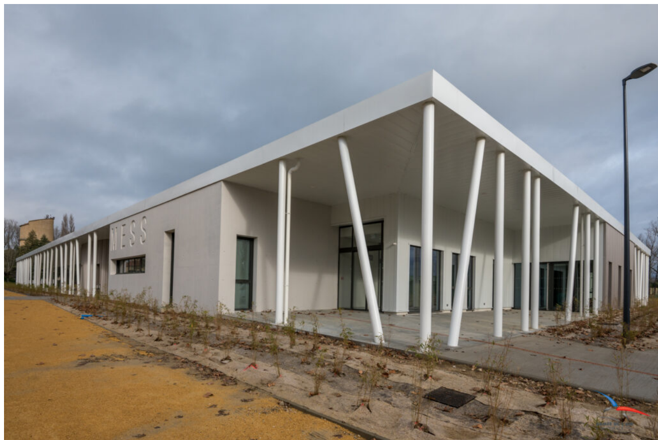
Le nouveau mess de la BA115 est en cours d'achèvement.

Pendant la durée du chantier, la base conserve sa mission souveraine de veiller à la sûreté aérienne du territoire français et de sa population et de neutraliser toute intrusion aérienne ennemie ou dangereuse avec des avions et des pilotes de chasse de Saint-Dizier, Mont-de-Marsan et Orange. Ils sont en état d'alerte permanent et capables de décoller en quelques minutes pour dissuader, éventuellement par des tirs de semonces, tout aéronef de survoler les sites sensibles comme les centrales nucléaires, les aéroports, les ports, les zones industrielles classées 'Seveso' ou les barrages.