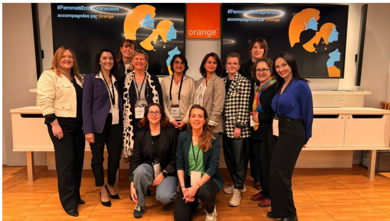
Femmes entrepreneuses saison 7

Depuis son lancement en 2018, plus de 700 femmes entrepreneuses ont été accompagnées par Orange dans toute la France. Le programme cible des start-ups technologiques : intelligence artificielle, cybersécurité, Web3, IoT (Internet of things, interconnexion entre un réseau d'objet et de terminaux connectés équipés de capteurs et d'autres technologies permettant de transmettre et de recevoir des données entre eux)... avec des fondatrices majoritaires ou cofondatrices à forte utilisation ou maîtrise de la tech.