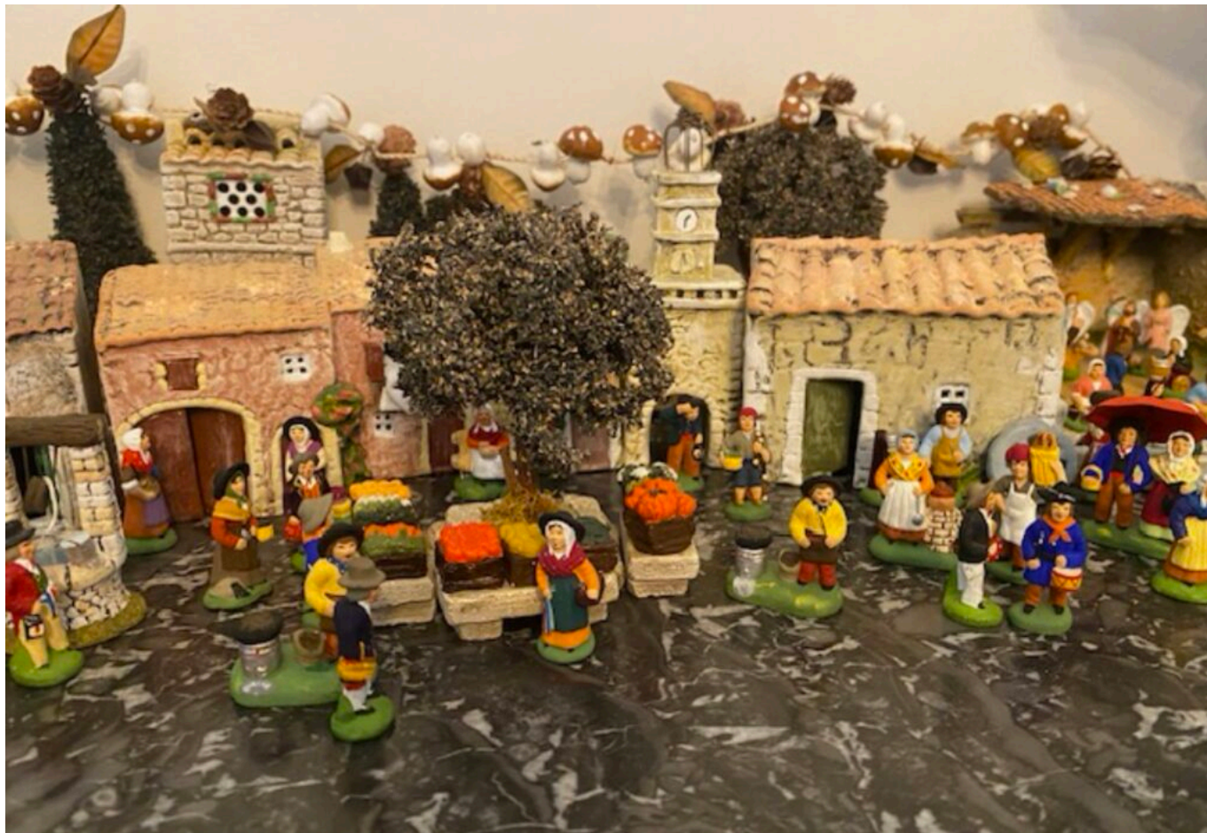
Santons Marcel Carbonel, Mise en scène Thalia CH, 5 ans, Copyright Michel H

des animations et la présence d'artisans prêts à partager leur passion.