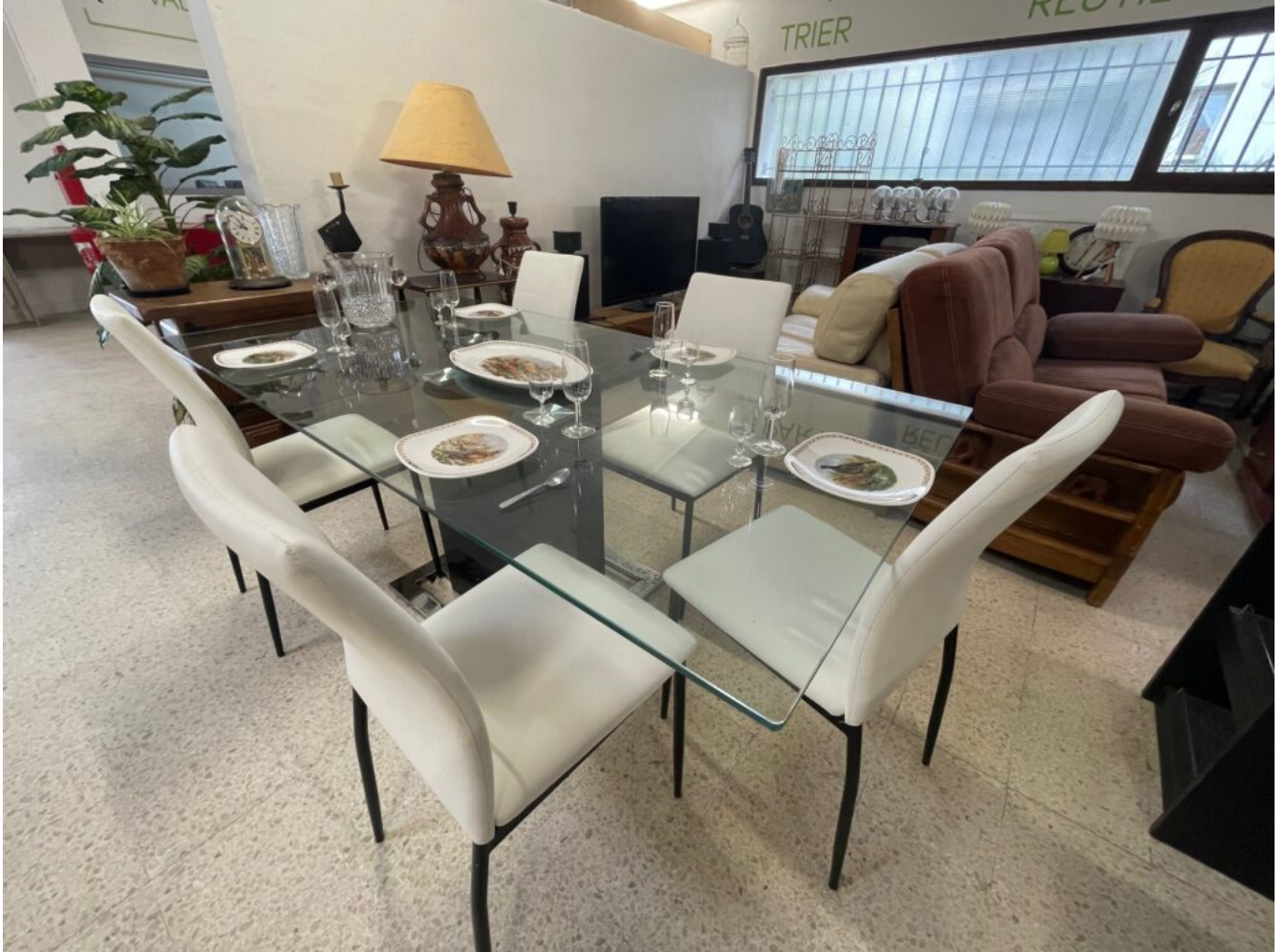
Un mobilier en parfait état