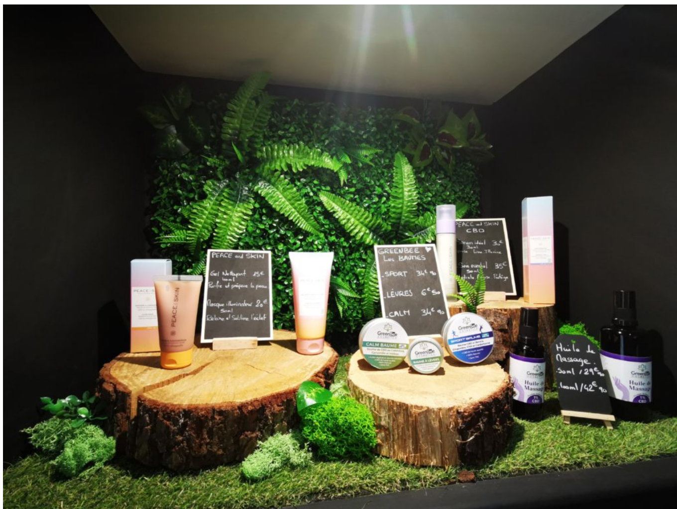
La gamme cosmétique, soin, massage, masque, baumes.