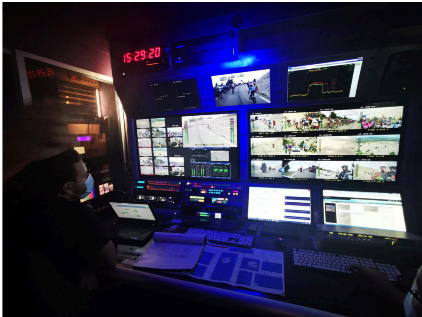
Les faisceaux lumineux jaillissent de toutes parts chez Globecast.

Ces dernières sont récupérées, traitées qualitativement et transmises au car de production de France Télévision. Ce dernier renvoie ensuite la réalisation à Globecast qui se charge de transmettre le produit fini par satellite, ce sont les images que vous voyez dans votre salon. Sur les multiples écrans, nous apercevons les captations des hélicoptères, les caméras privatives d'ASO et France Télévision, NBC, Eurosport et leurs commentateurs. La voix du réalisateur résonne depuis l'enceinte : « fais-moi un plan sur la moto 1, top ! Hélicoptère numéro 2 preview, prépare-toi ! »