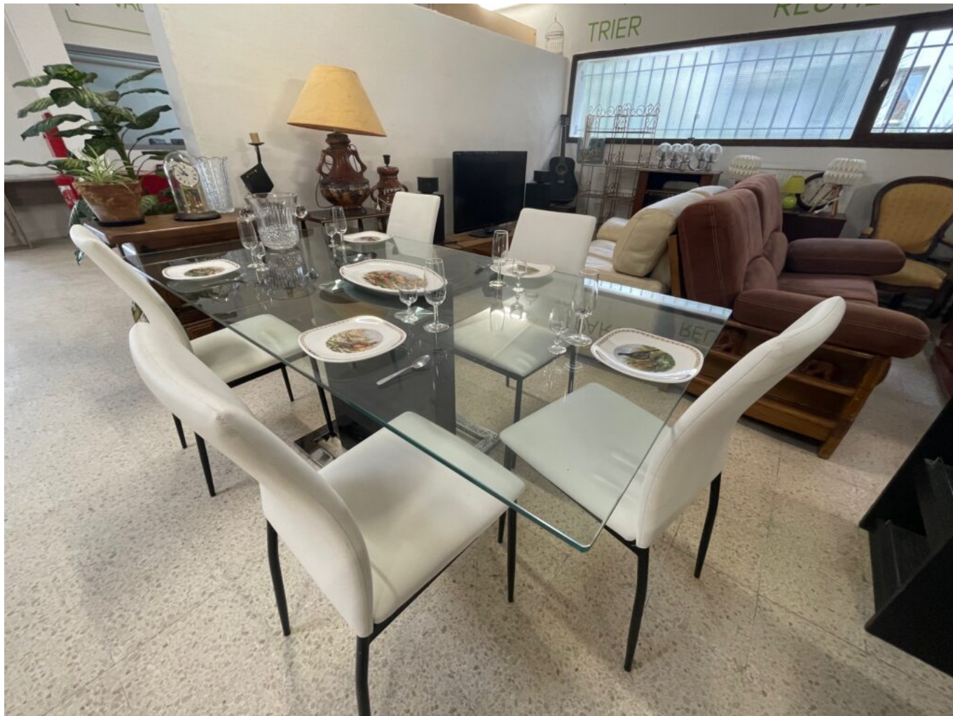
Un mobilier en parfait état