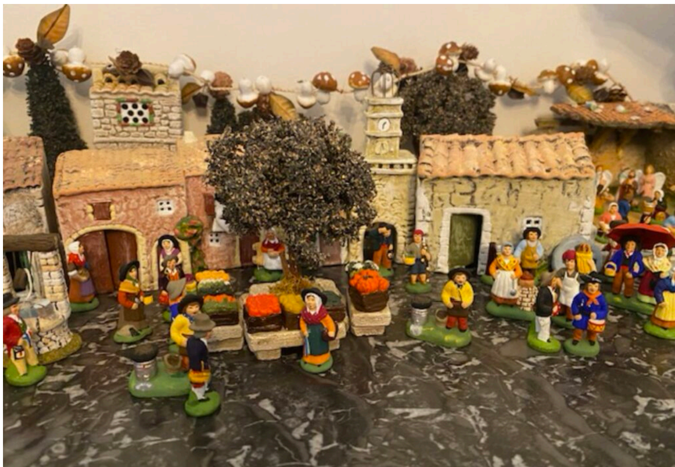
Santons Marcel Carbonel, Mise en scène Thalia CH, 5 ans, Copyright Michel H

Chaque stand est une porte ouverte sur un univers miniature façonné à la main : modelage de l'argile, cuisson, peinture, patine... Autant de gestes précis qui relèvent d'un art transmis de génération en génération. Le public, lui, découvre ce patrimoine vivant dans une ambiance chaleureuse, rythmée par des animations et la présence d'artisans prêts à partager leur passion.