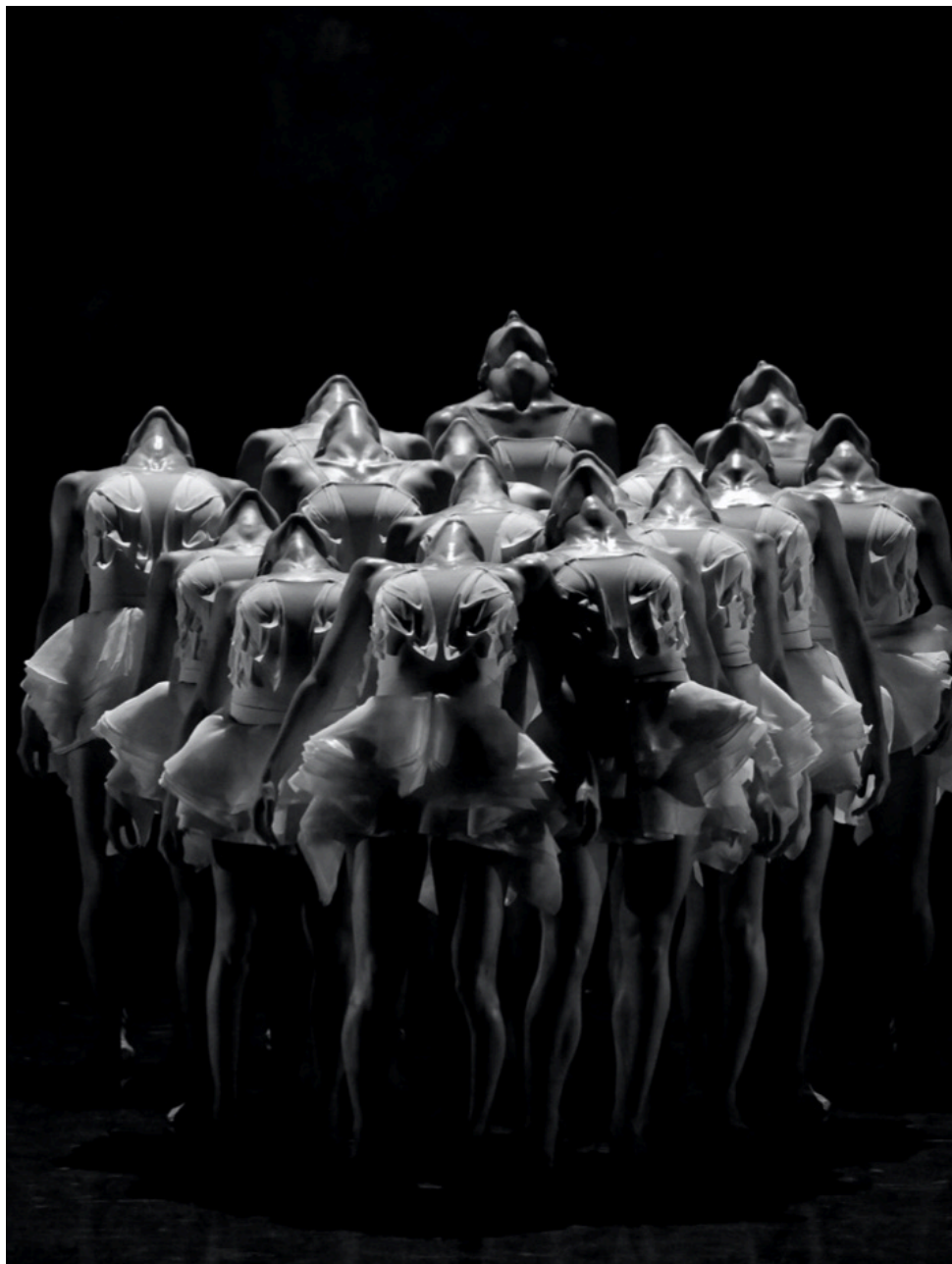
Le Lac des Cygnes.

Jean-Louis Grinda évoque alors la coproduction entre les Chorégies d'Orange et le Festival d'Aix-en-Provence qui se traduira en 2025 par un concert avec l'Orchestre des Jeunes de la Méditerranée et des chanteurs lyriques de demain, le 17 juillet. Le 22, 'Fantasia' de Disney avec les partitions célèberrissimes de Beethoven, Debussy, Elgar, Ponchielli, Saint-Saëns et Dukas.