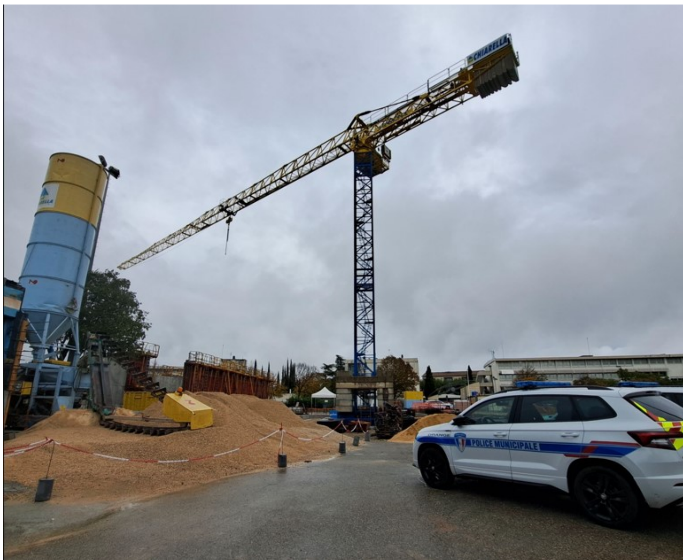
Le chantier du futur poste de la police municipale d'Orange.