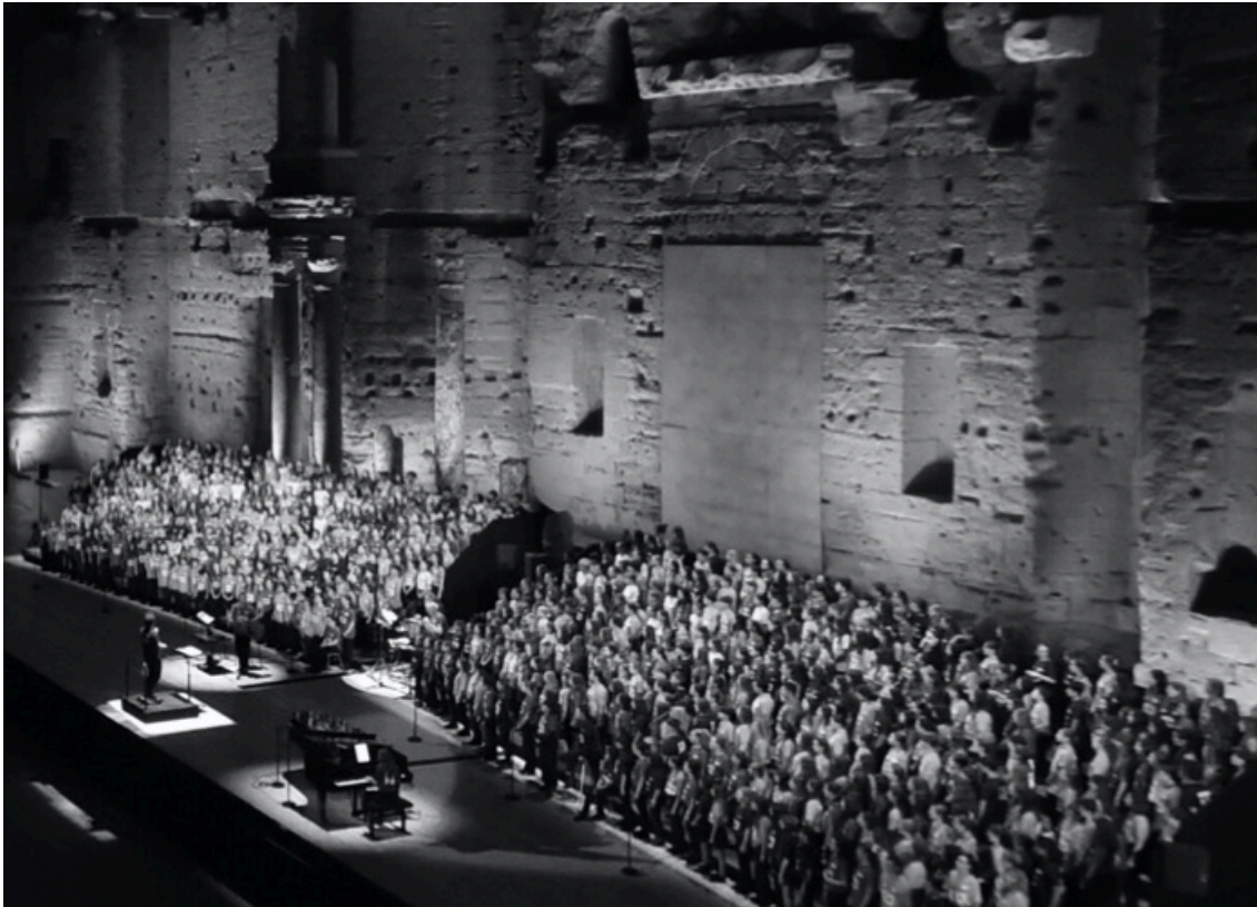
Pop the Opera.