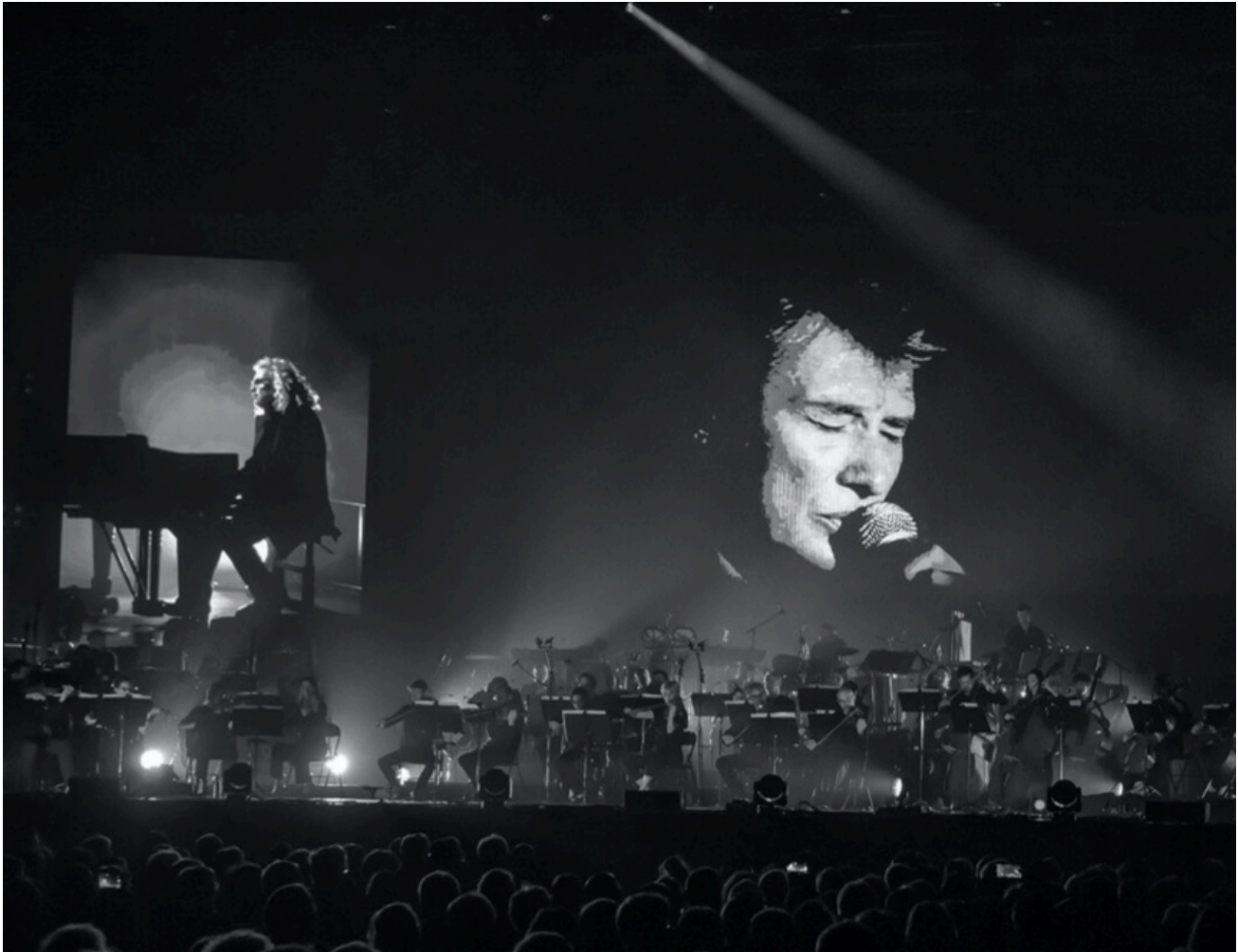
Johnny Symphonique.