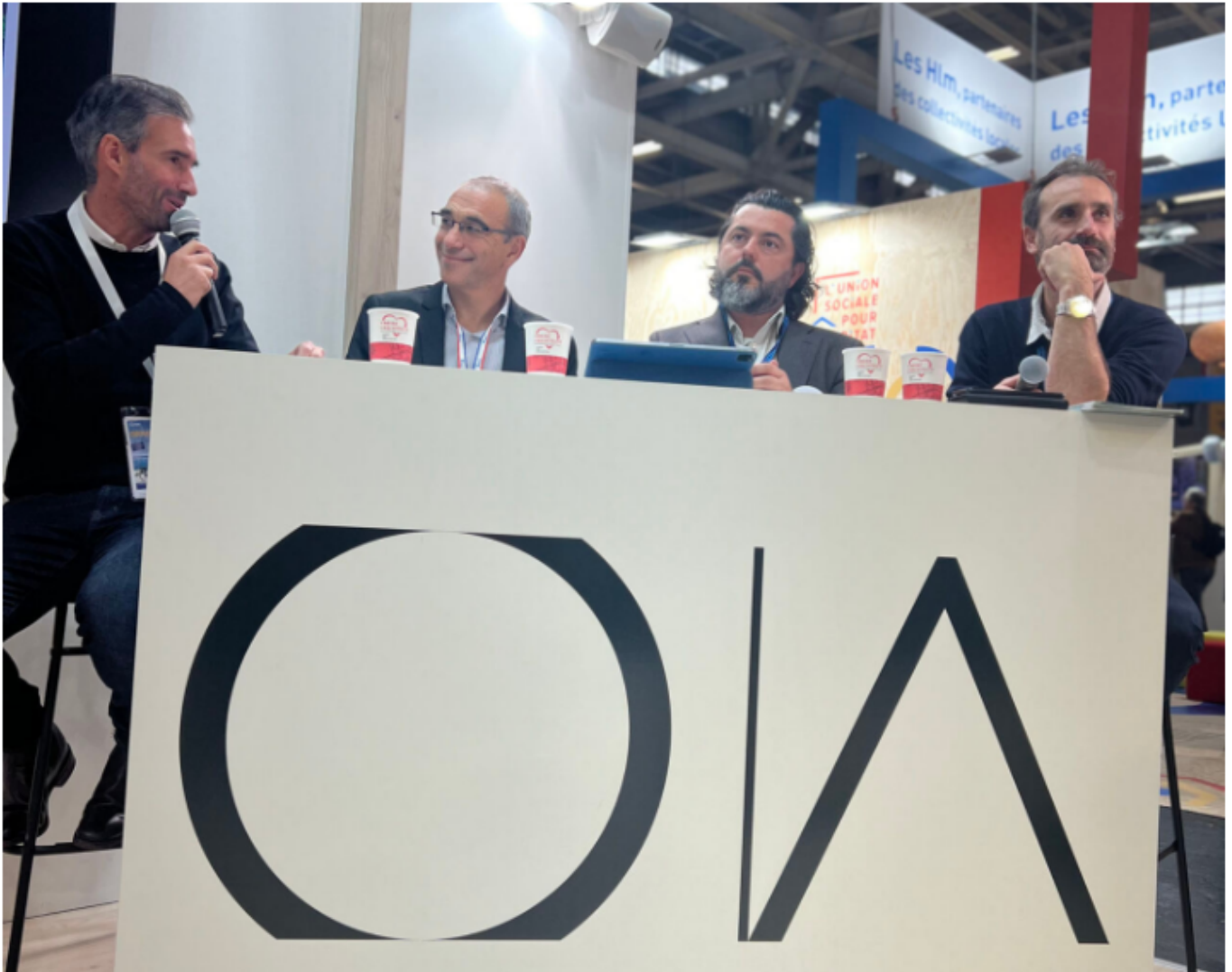
Moment de table ronde sur la construction bois régionale avec la participation de Fisbois Sud