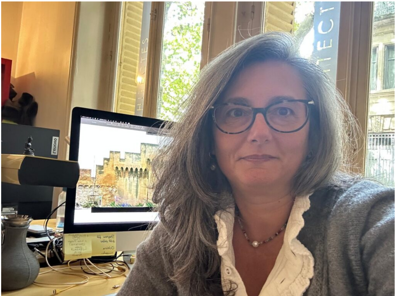
Raffaella Telese Copyright D3