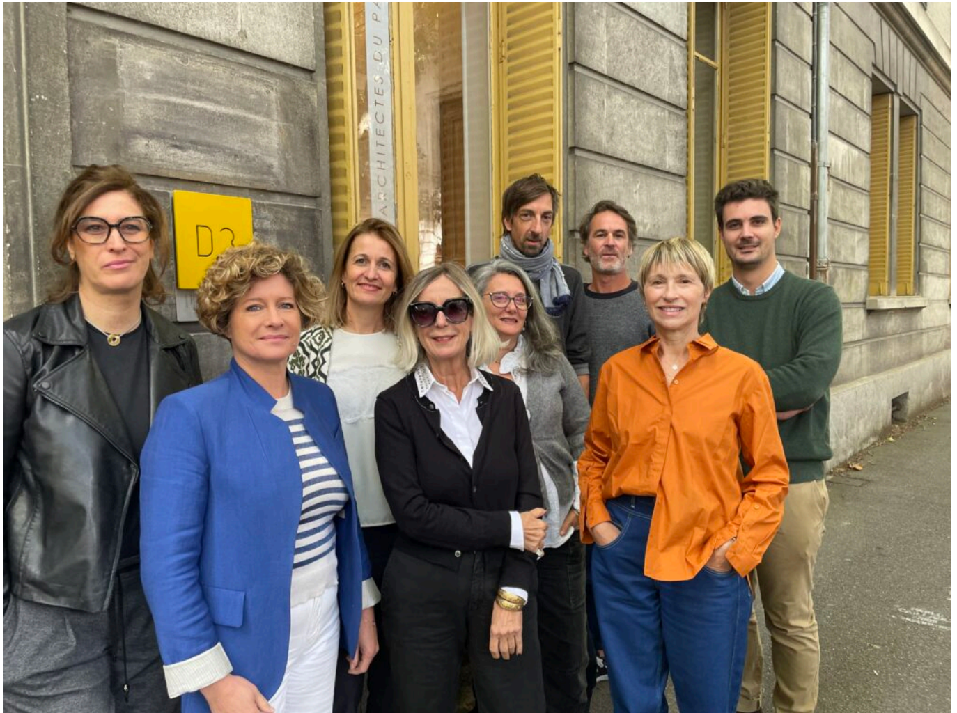
Les coworkers du D3