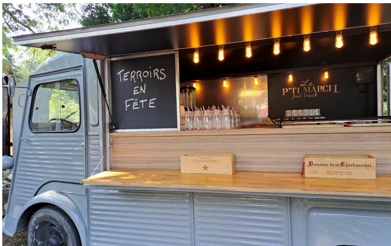
Le P'tit Marcel du P'tit camion

ma revanche sur ma scolarité. Ceux qui pensent qu'ils sont arrivés, en fait ne sont pas partis. Dans ma brigade aux Baux-de-Provence, nous sommes 67. Chacun a sa partition à jouer pour mettre en musique les recettes. Parfois, il faut des mois de travail pour concocter, concevoir et dresser une assiette, c'est un travail d'équipe et de longue haleine. Seul on va plus vite, mais ensemble on va plus loin ».