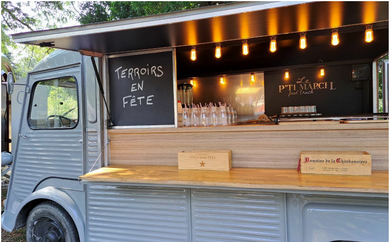
Le P'tit Marcel du P'tit camion

ma revanche sur ma scolarité. Ceux qui pensent qu'ils sont arrivés, en fait ne sont pas partis. Dans ma brigade aux Baux-de-Provence, nous sommes 67. Chacun a sa partition à jouer pour mettre en musique les recettes. Parfois, il faut des mois de travail pour concocter, concevoir et dresser une assiette, c'est un travail d'équipe et de longue haleine. Seul on va plus vite, mais ensemble on va plus loin ».