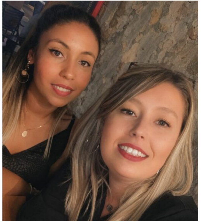
Les deux cofondatrices de BB Kitchen.