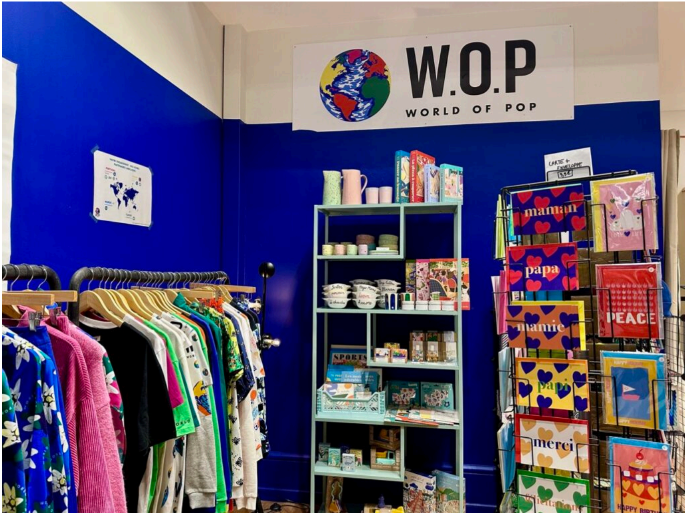
Un coin du pop-up store avignonnais.

des puzzles, de la papeterie, et bien d'autres surprises.