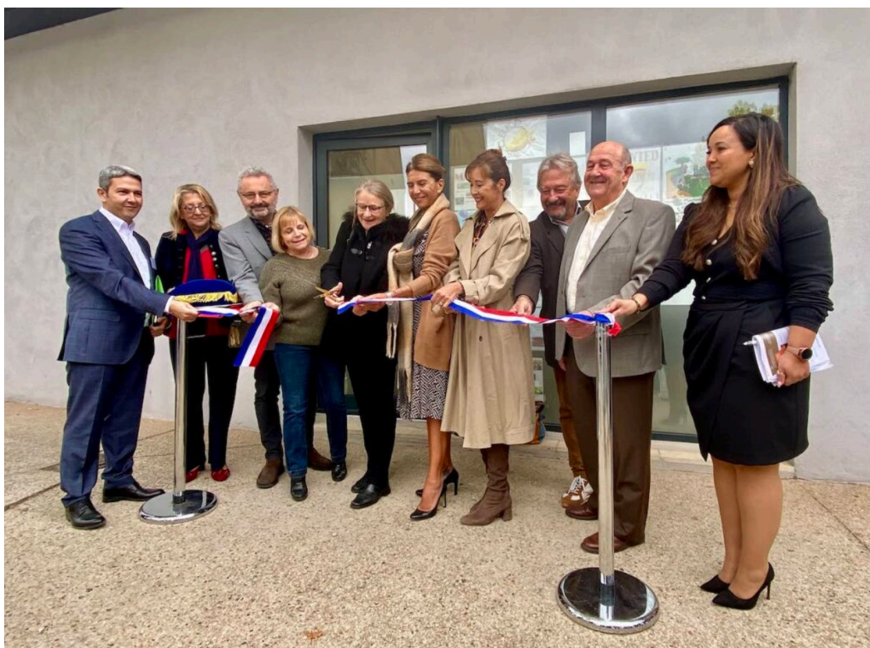
Les élus et responsables de l'école de la 2 e chance inaugurent l'antenne d'Apt.

Une fois la porte d'entrée passée, la première salle a tout d'une salle de classe traditionnelle, ou presque. Une dizaine d'ordinateurs sont à disposition. Au centre de la pièce, les bureaux des stagiaires, disposés à la manière d'une salle de réunion, pour que tous puissent se faire face. Derrière eux, un tableau blanc. Ils ont tous entre 16 et 25 ans, mais ne suivent pas des cours classiques. Chaque semaine, ils réalisent des projets et des activités pédagogiques, participent à des activités culturelles, citoyennes, d'entreprise ou de mobilité.