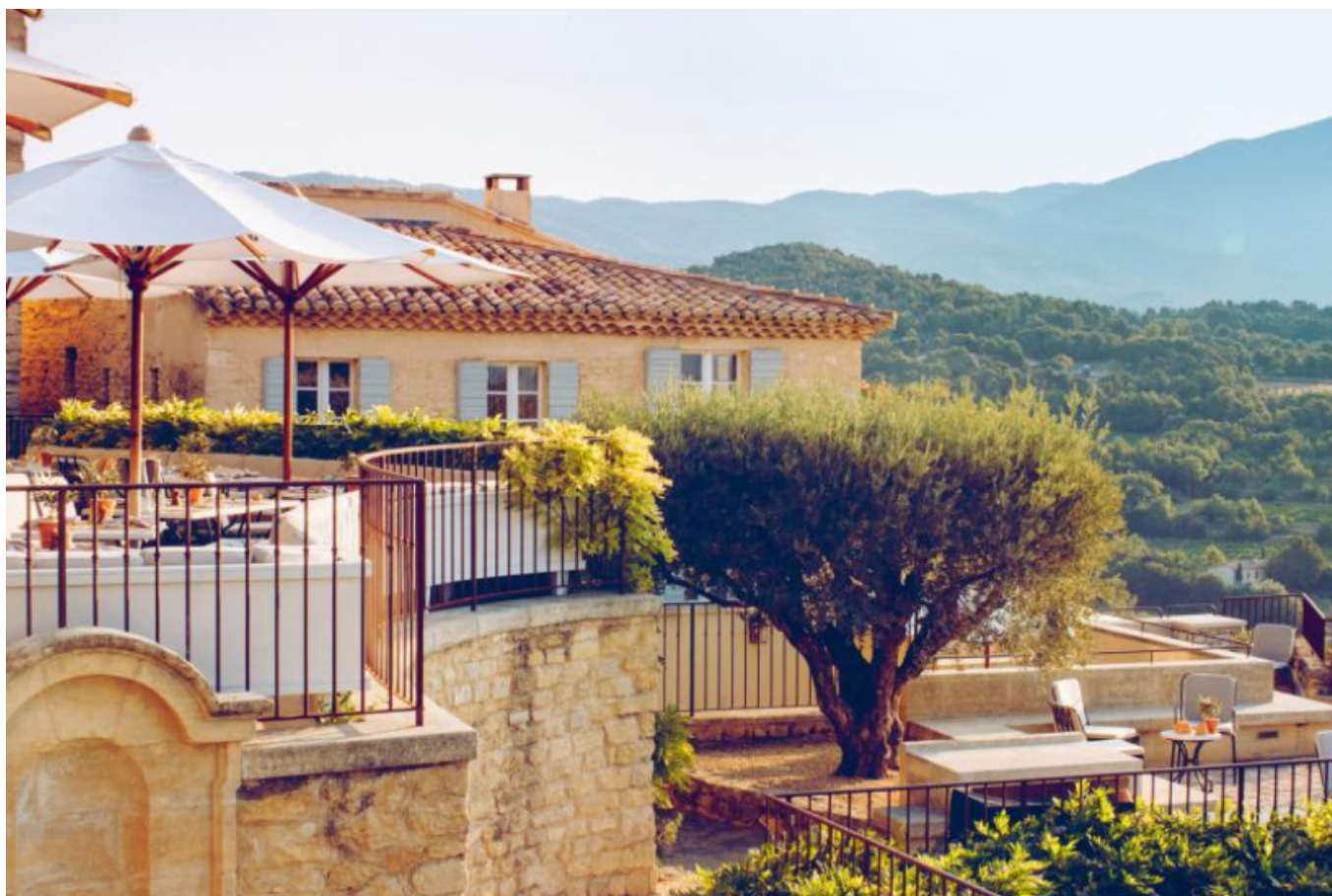
Vue depuis l'une des terrasses de l'Hôtel de Crillon Le Brave