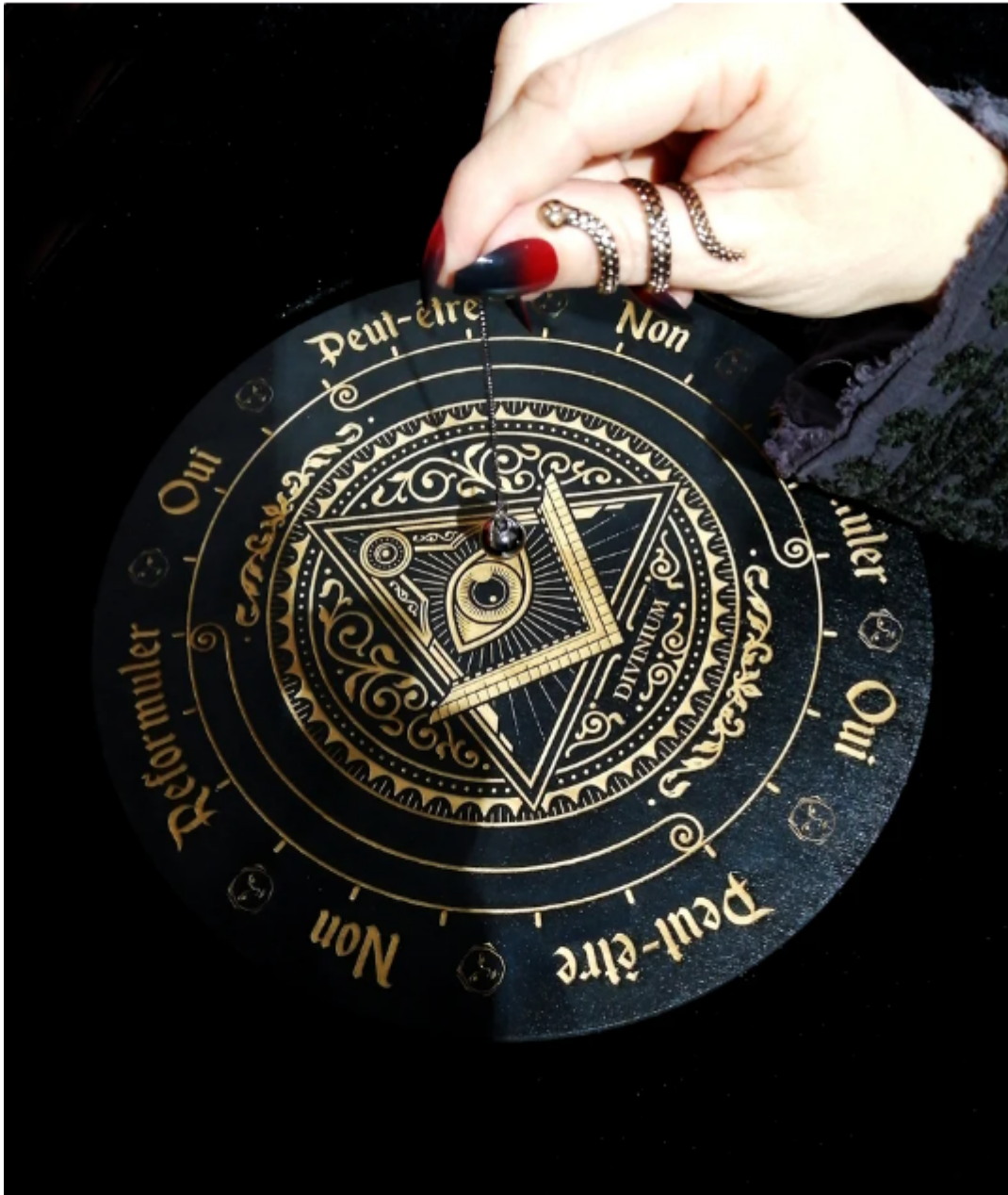
Planche de radiesthésie