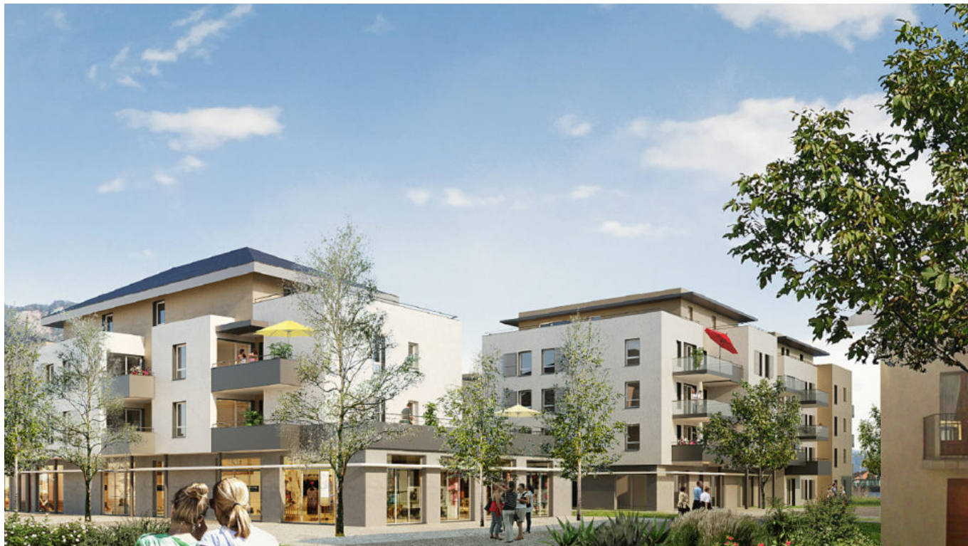
Exemple de construction

Et si l'on créait un drive de produits fermiers ?