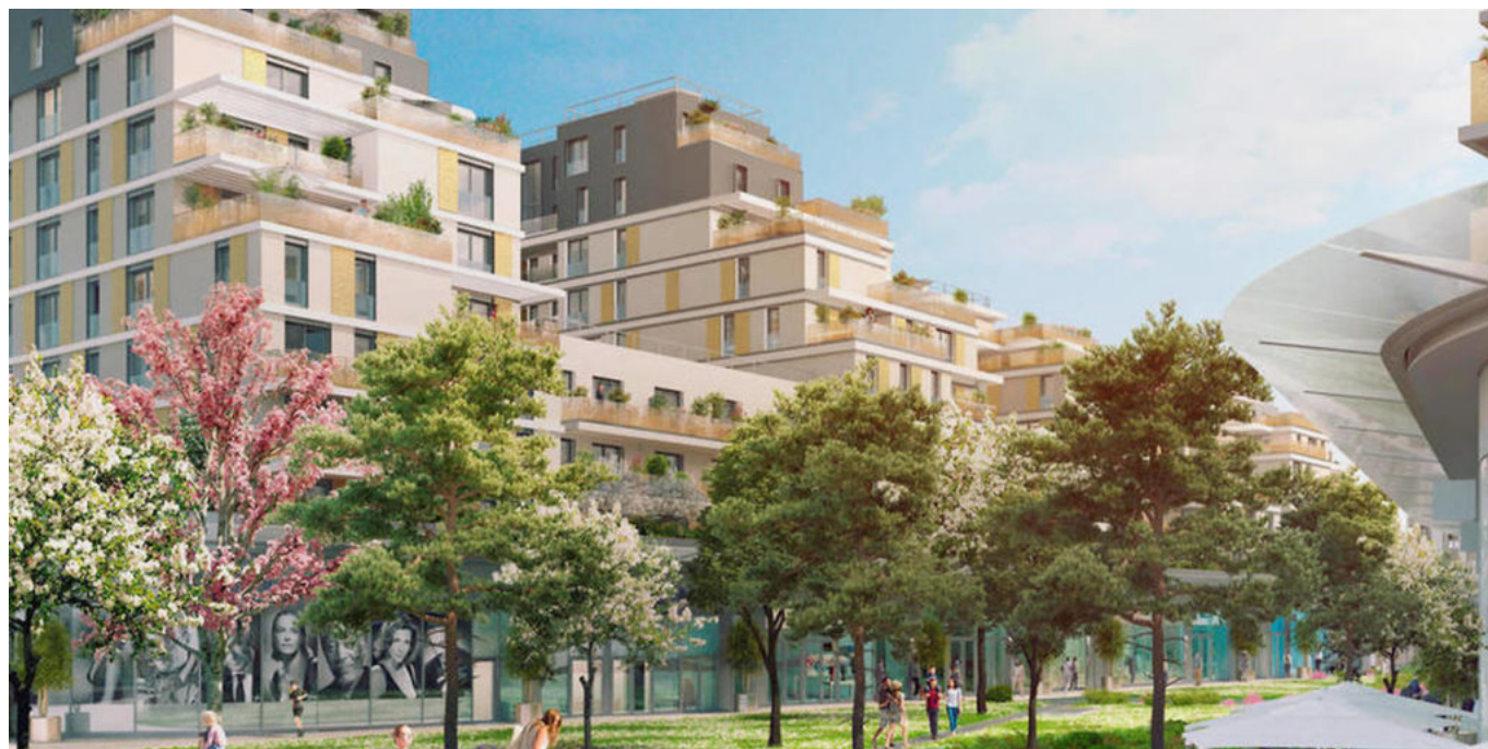
Exemple de construction

Le modèle d'Usufruit locatif social associe investisseurs privés, collectivités locales et bailleurs sociaux dans la production de logements, neufs ou anciens. Il repose sur un démembrement de propriété : l'usufruit du bien est détenu par un bailleur social tandis que sa nue-propriété appartient à un investisseur privé. Le bailleur social loue les logements à des ménages sous conditions de ressources, moyennant des loyers sociaux ou intermédiaires. Le nu-propriétaire, quant à lui, ne perçoit aucun loyer mais il bénéficie d'un régime fiscal favorable et le bailleur social lui garantit la libération du bien et sa remise en état à l'échéance de la convention.