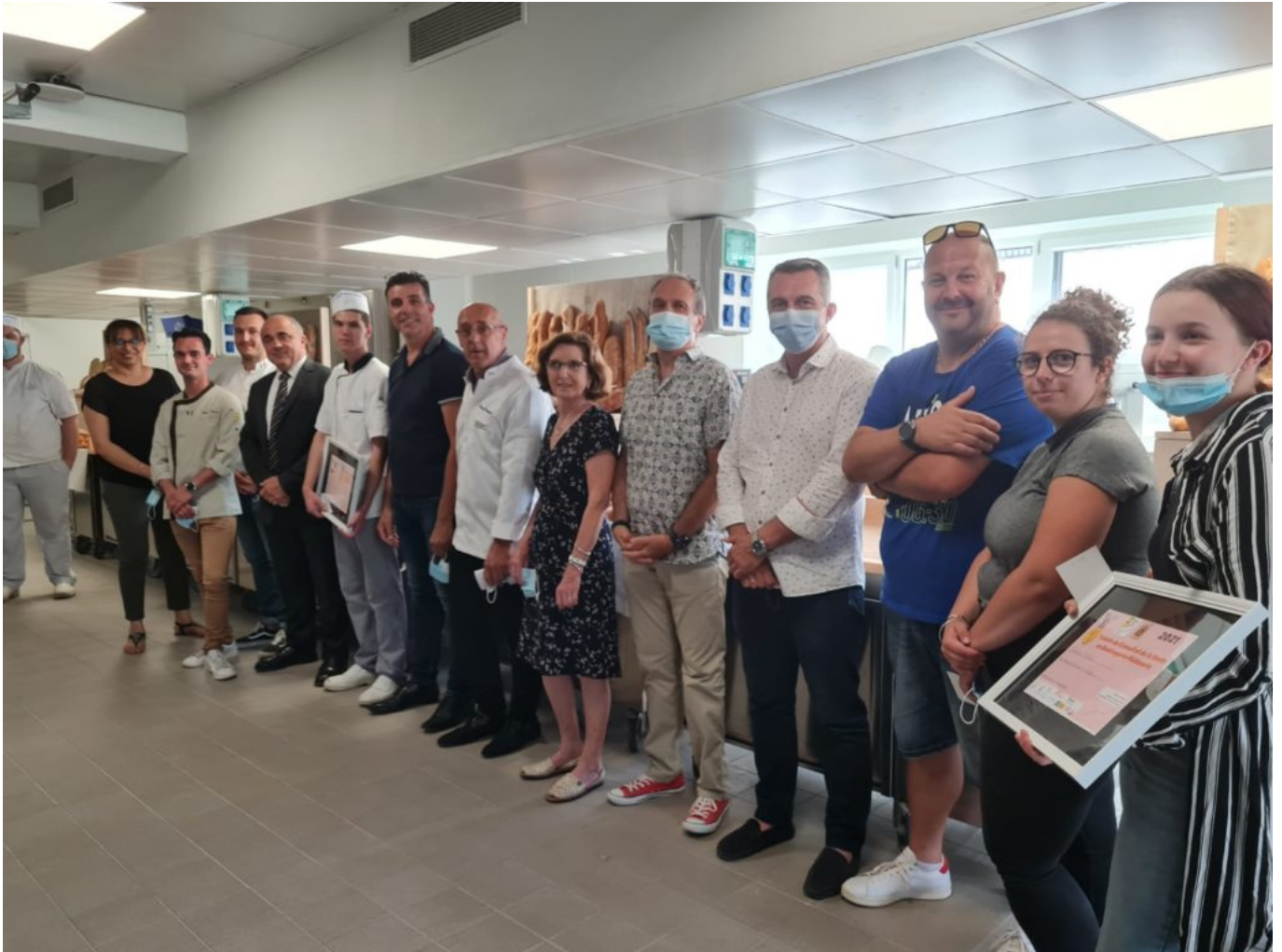
Les gagnants représenteront le Vaucluse lors du concours régional Paca Corse