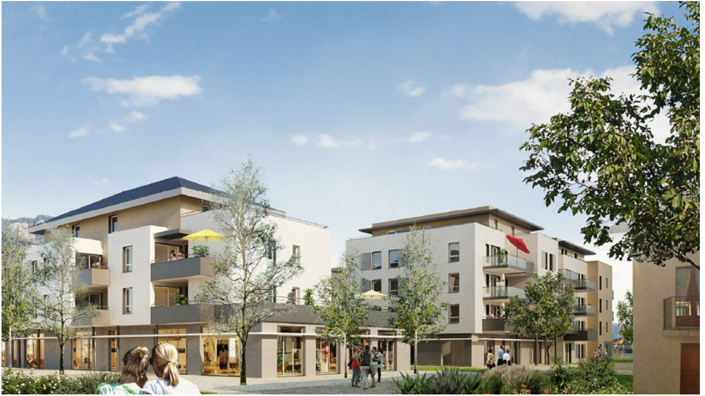
Exemple de construction