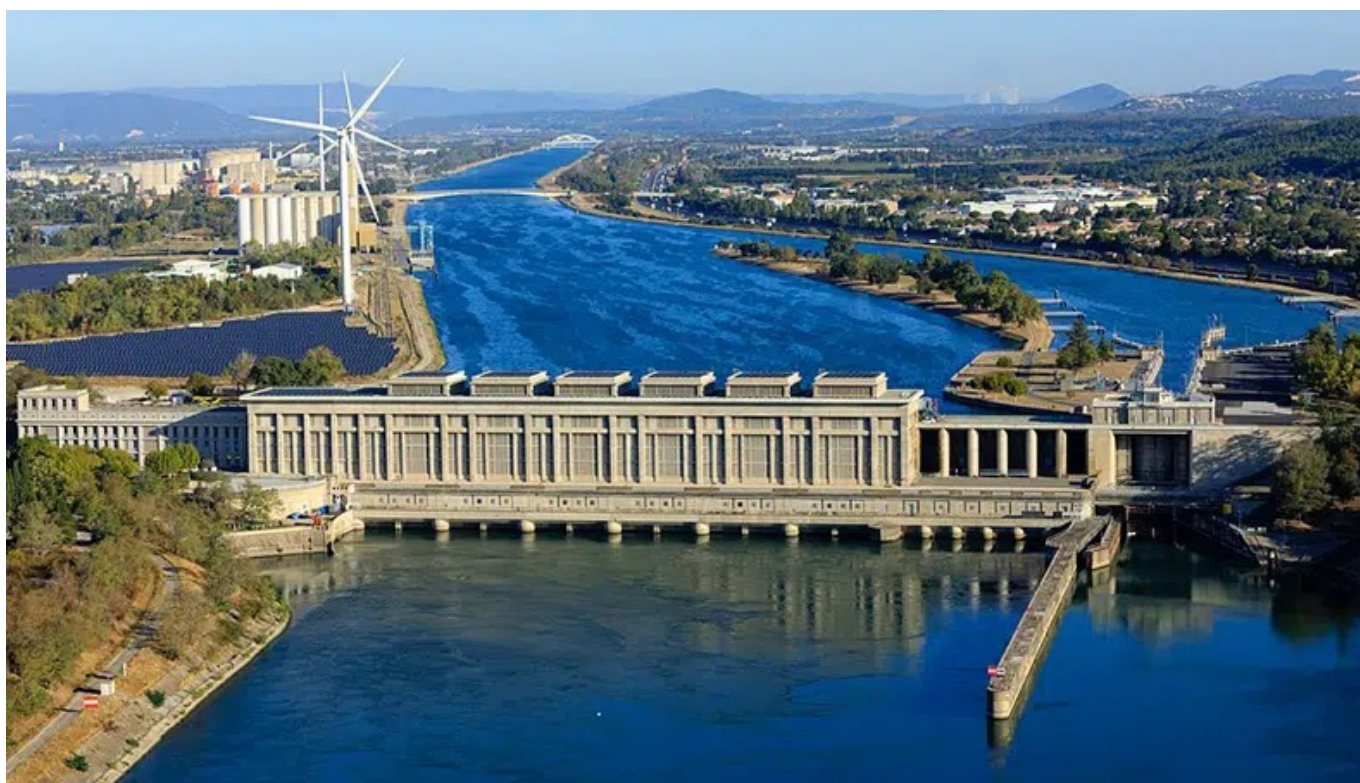
Centrale hydroélectrique de Bollène . ©CNR Bollène

Dans le Vaucluse, l'hydroélectricité représente aujourd'hui 84% de la production d'énergie verte et le photovoltaïque 11% (source : Enedis). Le plus gros site de production d'électricité hydraulique est installé au niveau de la commune de Bollène, sur un canal parallèle au Rhône (barrage de Donzère-Montdragon). Il a été inauguré par Vincent Auriol en 1952, c'est-à-dire une éternité ! Il a fallu attendre 2019 pour qu'un autre projet d'envergure utilisant des énergies renouvelables soit mis en œuvre. Il s'agit de la centrale photovoltaïque flottante de Piolenc, avec ses 47 000 panneaux (soit 22 hectares), elle fût un temps la plus grande d'Europe.