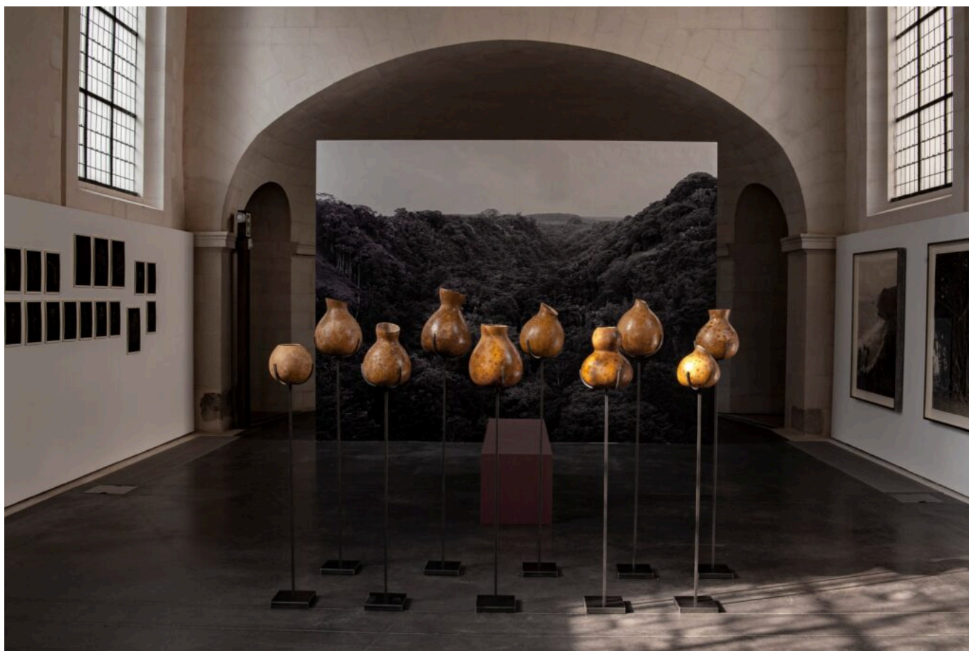
L'exposition "Circumnavigations" au MAT, centre d'art contemporain du Pays d'Ancenis