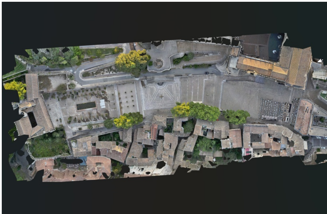
Photogrammétrie - Palais des papes.

Cette technologie permet de reconstituer la topographie des lieux en trois dimensions, offrant une vision complète et précise des volumes, des textures et des détails architecturaux. Les données recueillies servent à la fois à l'ingénierie des travaux et à la conservation du patrimoine, garantissant que toute intervention se fasse dans le respect strict de l'existant.