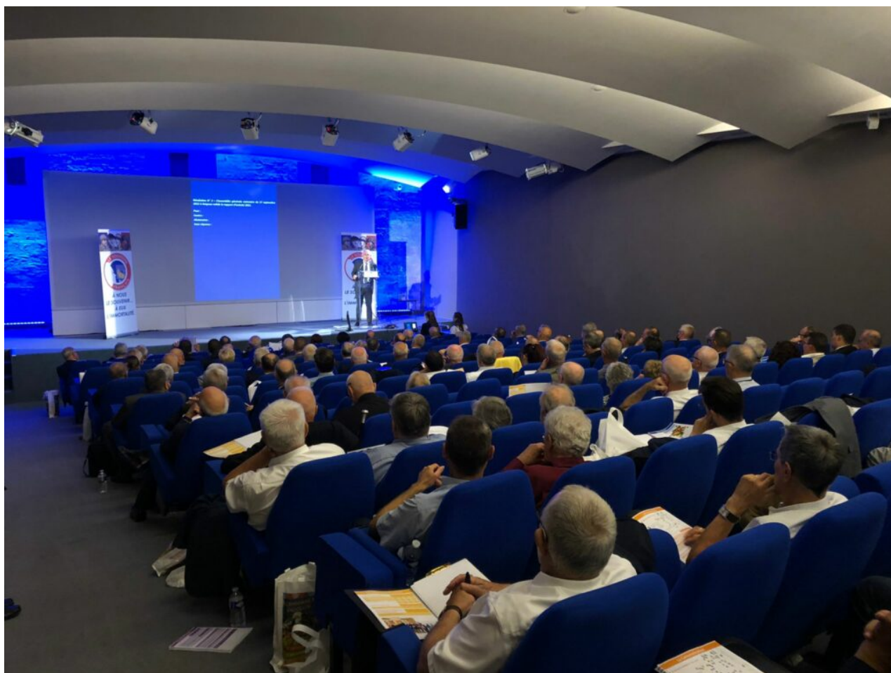
Le Souvenir français en AG au centre des congrès du Palais des papes.