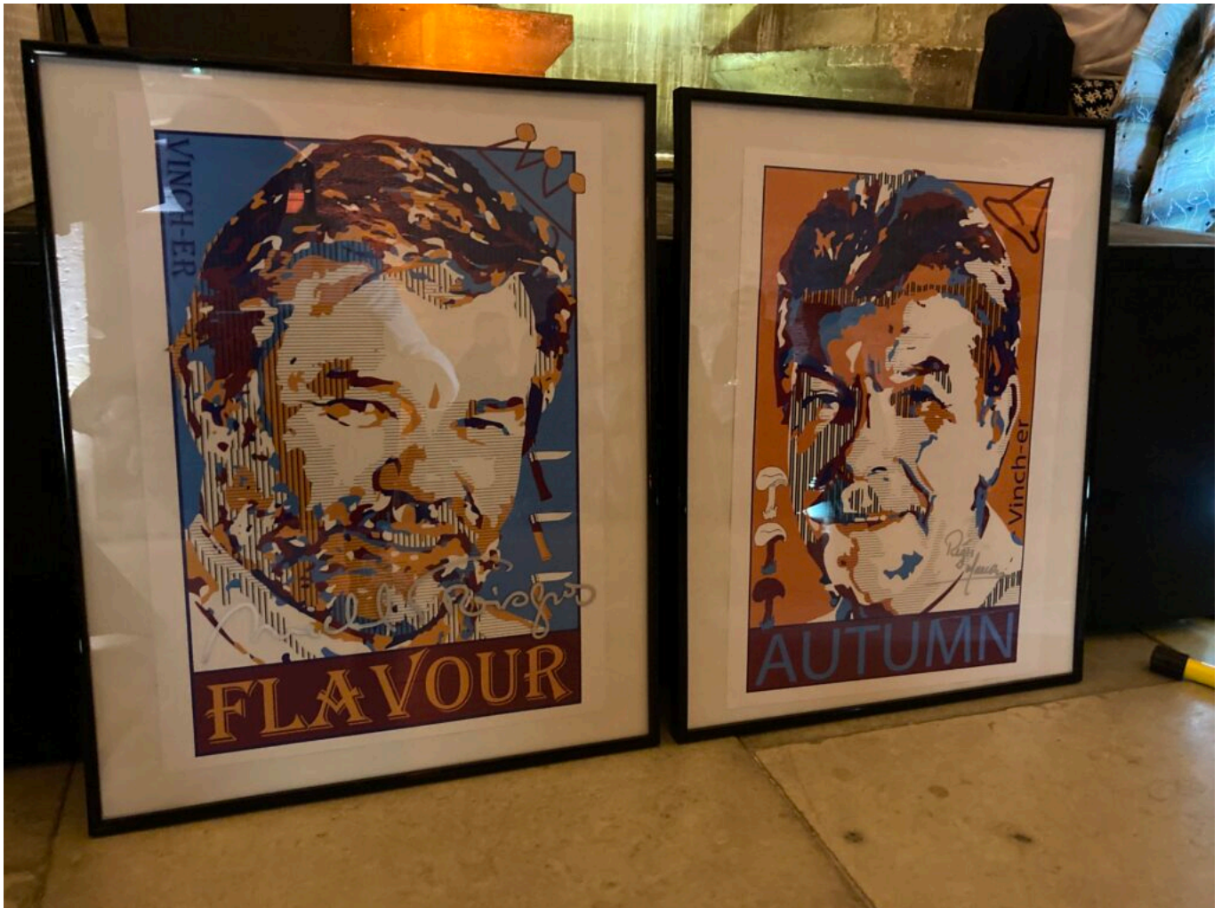
Portraits signés de Michel Troisgros (à gauche) et de Régis Marcon (à droite)