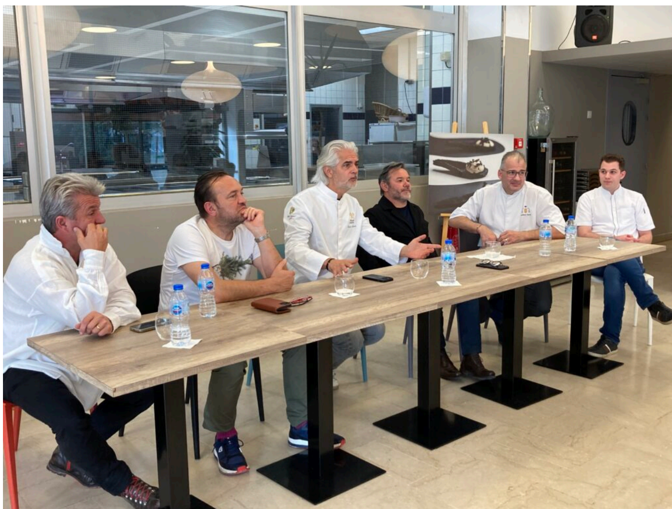
De gauche à droite : les chefs Edouard Loubet, Emmanuel Renaut, Xavier Mathieu, Michel Troisgros, Guilhem Sevin

« La transmission fait partie de notre ADN, explique Emmanuel Renaut. L'important, c'est de faire rêver les jeunes qui se destinent à notre métier ». Transmettre à la future génération et l'écouter. « La jeune génération est remplie d'engouement, d'idées, de questionnement. Pour nous c'est vachement enrichissant. Non seulement, on y va pour transmettre ce qu'on nous a transmis, mais en même temps, on écoute parce que ce sont les chefs de demain », ajoute Xavier Mathieu .