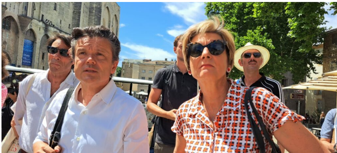
Jean-Michel Othoniel , à gauche, aux côtés de Cécile Helle, maire d'Avignon.

Une déambulation onirique est proposée au spectateur du 28 juin au 4 janvier : Palais des Papes, Pont d'Avignon, Musée du Petit-Palais, musées Calvet, Requien, Lapidaire, Bains Pommer et Collection Lambert. Chaque fois Jean-Michel Othoniel a imaginé une œuvre adaptée au décor, à l'époque, au cadre. « C'est l'architecture qui m'a poussé, une forme d'énergie, de dynamique dans des lieux solides, en pierre et monochromes. Ici, au Palais des Papes, passent 7 000 visiteurs par jour. Je dois, avec mes œuvres, surfer sur cette vague de flux. Sur les 260 œuvres présentées à Avignon, j'en ai créé 140 nouvelles pour Avignon. Et l'idée directrice - la passion entre Pétrarque et Laure, les 366 poèmes qui lui sont dédiés - a aussi inspiré les plus grands, Michel-Ange, Shakespeare, même Pier-Paolo Pasolini. La ville d'Avignon elle-même est un musée, avec ses façades, ses bâtiments, son architecture. »