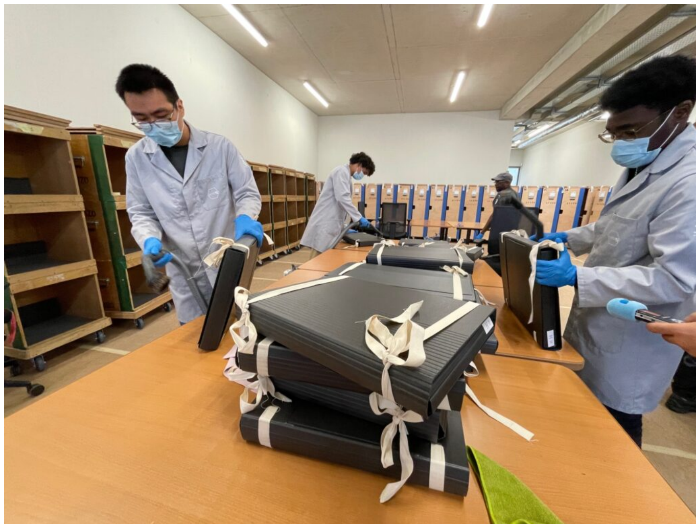
Le dépoussiérage

Elle s'est faite dès 2017 avec l'inventaire et le reconditionnement des premiers documents dans des boîtes. Les premiers reconditionnements et dépoussiérages ont été réalisés par la société FFAS , tout en effectuant un récolement détaillé : nature du document, référencement, cote et géolocalisation dans le palais. Les boîtes balisées -les balises sont une feuille de couleur qui indique les boîtes à prendre- sont ensuite insérées dans une Jeannette, armoire roulante en bois faites sur mesure pour pouvoir rouler dans les allées du palais et être insérées dans un camion ou une camionnette sous scellés. C'est là qu'intervient la société Avizo qui assure le déplacement et un second dépoussiérage. Les Jeannettes sont ensuite déchargées et les boîtes dépoussiérées avant d'être déplacées, par le déménageur, dans son magasin définitif. Chaque document est ensuite entré en fichier informatique pour situer son nouvel emplacement.