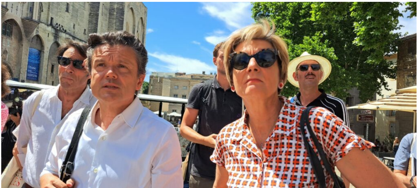
Jean-Michel Othoniel , à gauche, aux côtés de Cécile Helle, maire d'Avignon.

Une déambulation onirique est proposée au spectateur du 28 juin au 4 janvier : Palais des Papes, Pont d'Avignon, Musée du Petit-Palais, musées Calvet, Requien, Lapidaire, Bains Pommer et Collection Lambert. Chaque fois Jean-Michel Othoniel a imaginé une œuvre adaptée au décor, à l'époque, au cadre. « C'est l'architecture qui m'a poussé, une forme d'énergie, de dynamique dans des lieux solides, en pierre et monochromes. Ici, au Palais des Papes, passent 7 000 visiteurs par jour. Je dois, avec mes œuvres, surfer sur cette vague de flux. Sur les 260 œuvres présentées à Avignon, j'en ai créé 140 nouvelles pour Avignon. Et l'idée directrice - la passion entre Pétrarque et Laure, les 366 poèmes qui lui sont dédiés - a aussi inspiré les plus grands, Michel-Ange, Shakespeare, même Pier-Paolo Pasolini. La ville d'Avignon elle-même est un musée, avec ses façades, ses bâtiments, son architecture. »