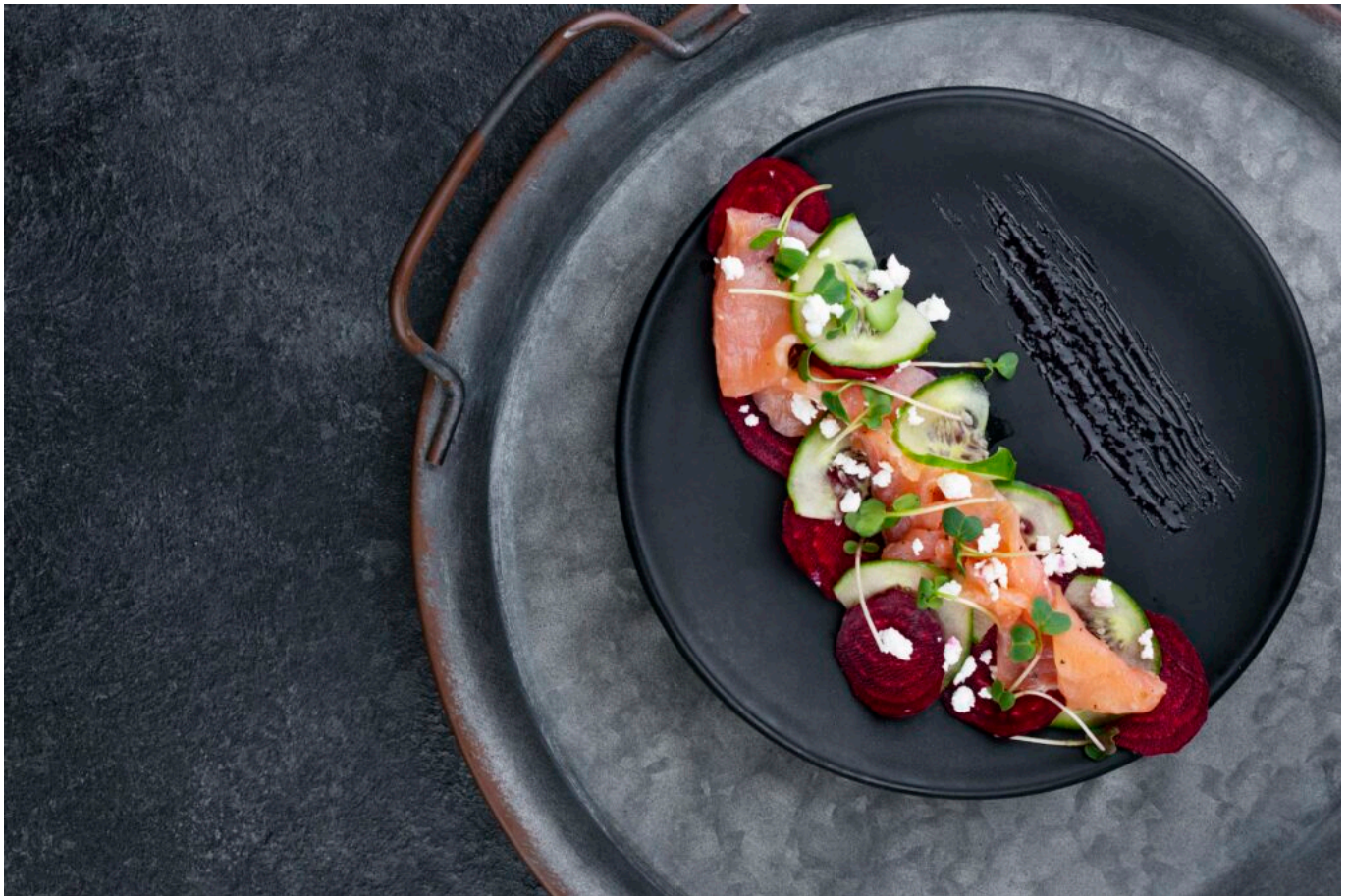
Repas étoilé