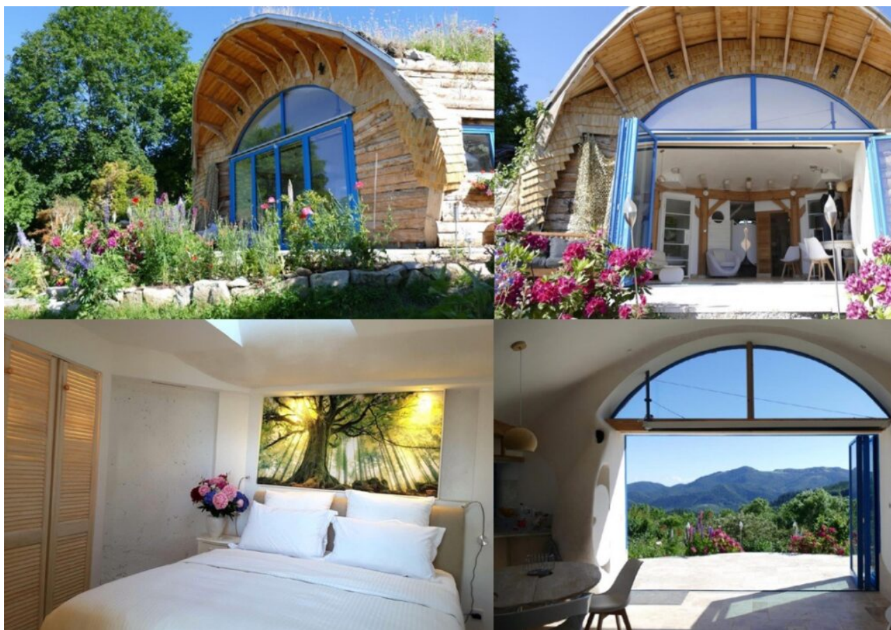
Un éco-gîte 'Panda' dans le Haut-Rhin.

proposent aux visiteurs des randonnées à pied ou à vélo sur des circuits d'observation de la faune et la flore. En 2014 a été lancée l'opération 'Je pars, tu pars, il ou elle part' (en vacances) pour les familles défavorisées. 50 000€ ont été collectés et reversés au Secours Catholique qui s'est occupé des billets de train et des loisirs des parents et des enfants. Pendant la crise sanitaire, en 2020, une Opération Solidarité Soignants a permis d'accueillir infirmières et brancardiers dans des gîtes proches des hôpitaux à moindre coût.