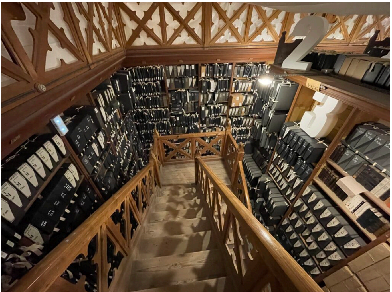
Sous les bâches les Archives départementales