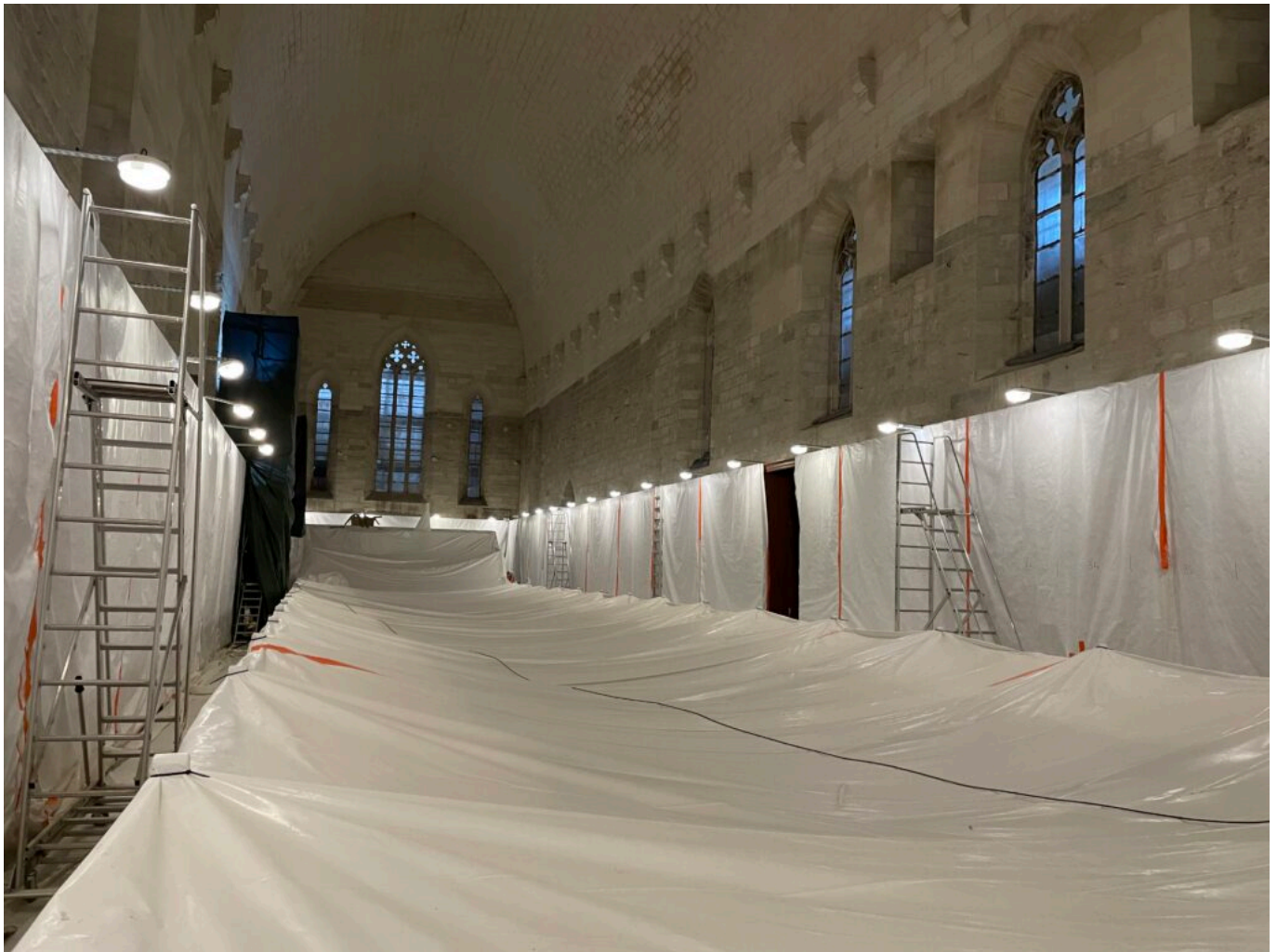
La Chapelle Benoît XII entièrement bâchée