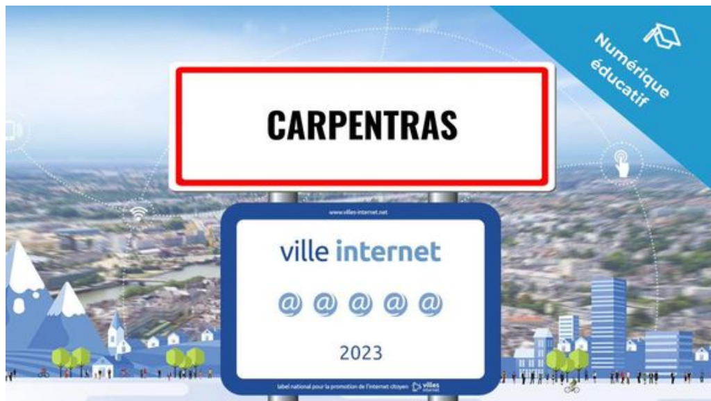
Figure de proue de cette excellence numérique départementale, avec ses 5 @@@@ Carpentras décroche le niveau le plus élevé de ce label récompensant chaque année les collectivités qui œuvrent significativement pour la démocratisation des technologies de l'information et de la communication et de leurs usages citoyens.

Carpentras, Courthézon et Montoux figurent parmi les 257 collectivités françaises à apparaître dans le palmarès 2023 des ' Territoires, villes et villages internet ' qui vient d'être dévoilé lors d'une cérémonie de remise de prix qui s'est tenue à Albi. Placée sous le haut patronage du président de la République, cette distinction est remise depuis 1998 par l'association ' Villes internet ' qui s'est donnée pour mission d'accompagner le déploiement des politiques publiques numériques locales.