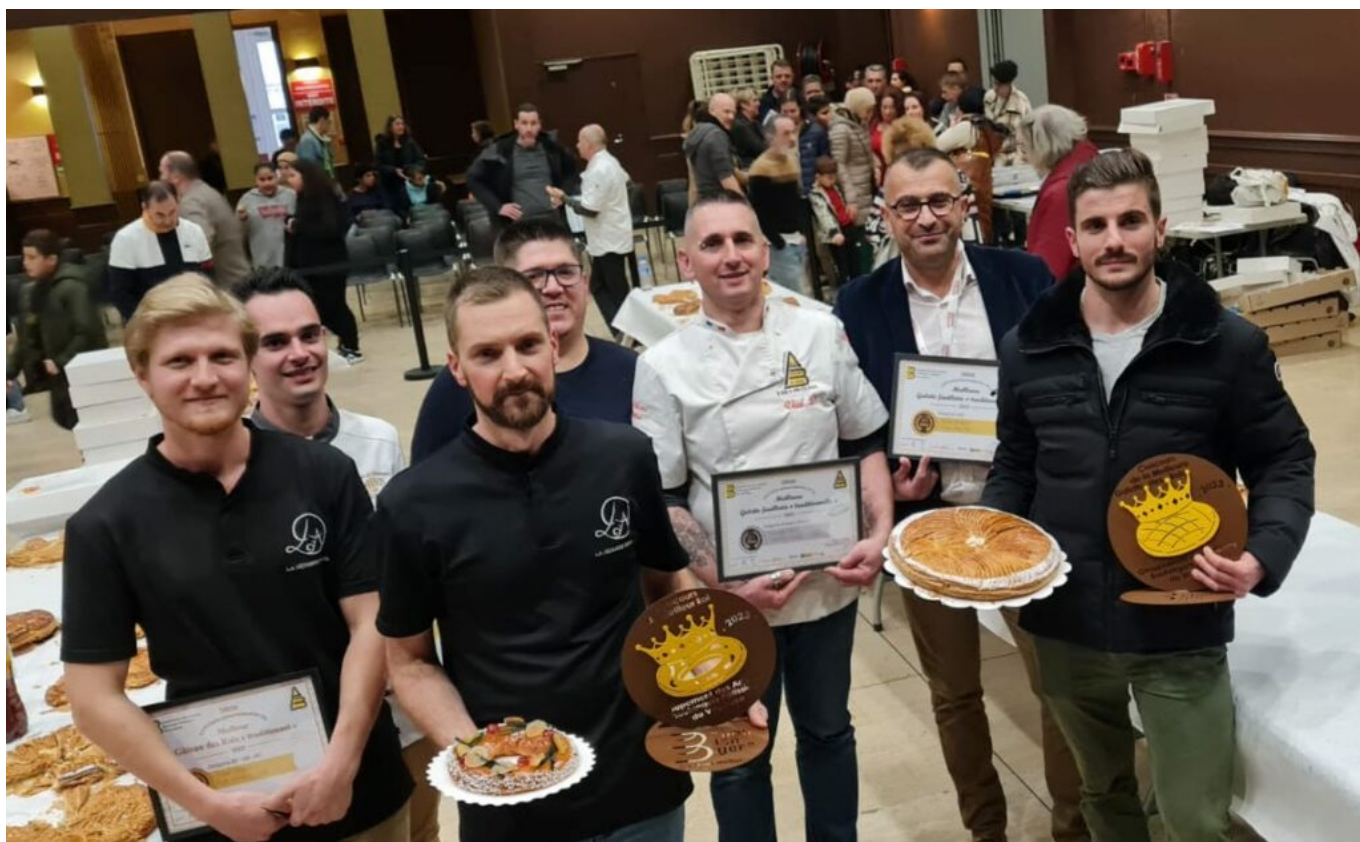
Une partie des lauréats du concours.