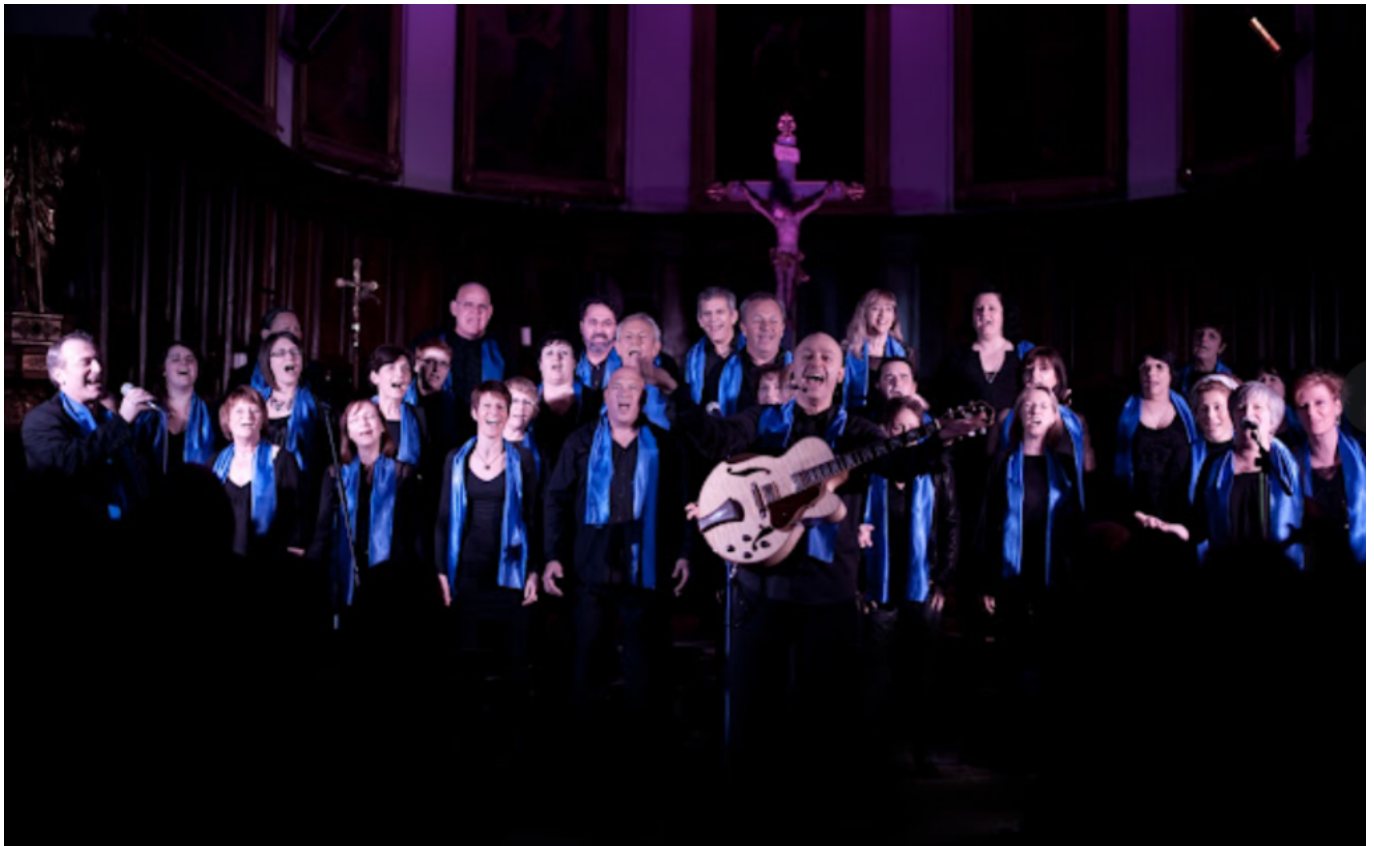
Vaucluse Gospel Singers

Dimanche 17 décembre la parade des Frostys se déroulera à 14h, 15h, 16h et 17h30. Bandura proposera un spectacle de musique du monde aux consonances provençales et de danse, à 15h, en salle Tinel. Le billet pour les plus de 12 ans est de 5€. A 17h, la crèche vivante enthousiasmera les pontétiens et leurs amis, tandis que le défilé du groupe Canto Cigalo donnera le ton à ce temps enchanté de l'avent. Pour tous, idées cadeaux, restauration salée et sucrée, jeux de bois, manèges forains et exposition d'automates au cœur du château de Fargues.