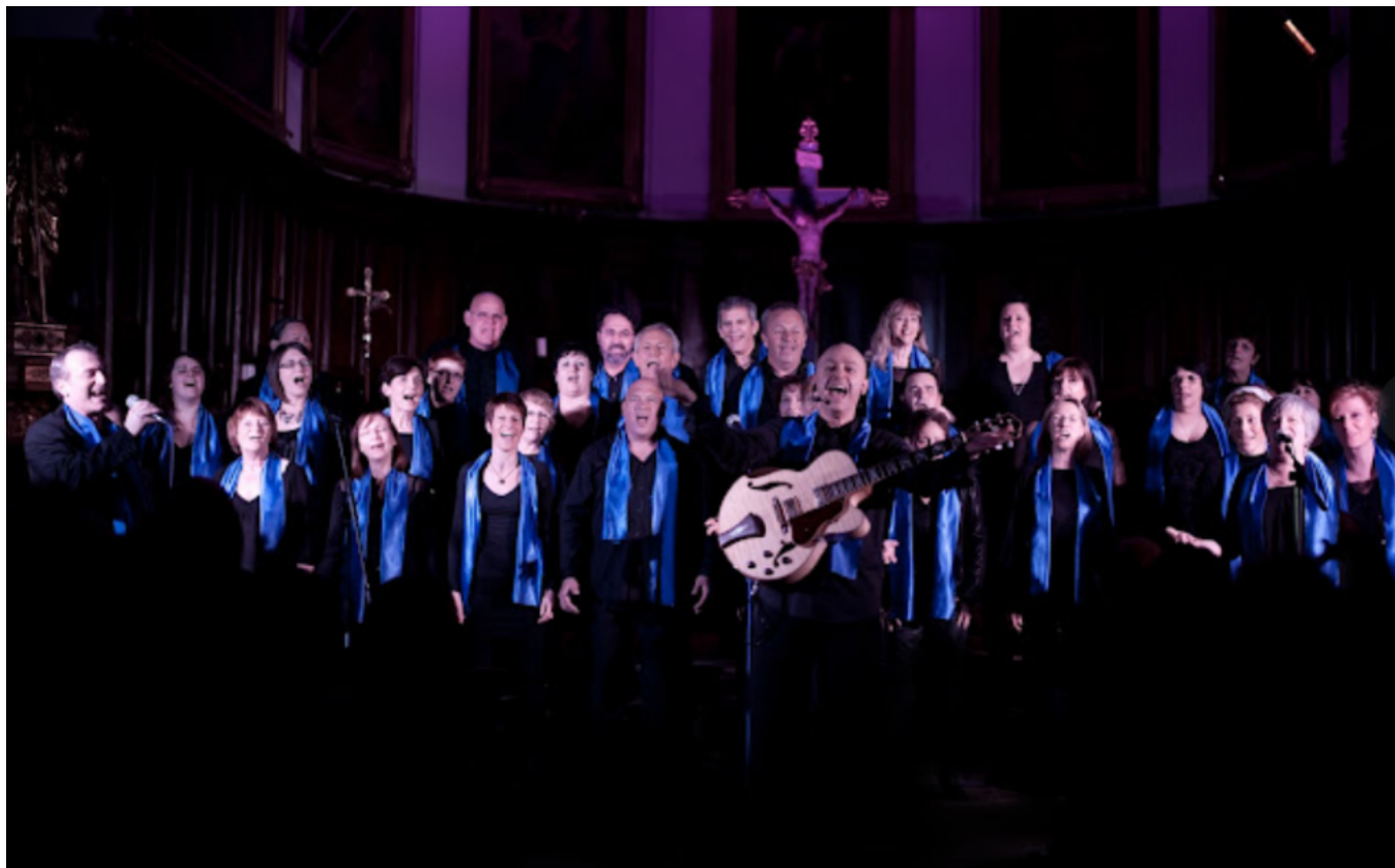
Vaocluse Gospel Singers

Dimanche 17 décembre la parade des Frostys se déroulera à 14h, 15h, 16h et 17h30. Bandura proposera un spectacle de musique du monde aux consonances provençales et de danse, à 15h, en salle Tinel. Le billet pour les plus de 12 ans est de 5€. A 17h, la crèche vivante enthousiasmera les pontétiens et leurs amis, tandis que le défilé du groupe Canto Cigalo donnera le ton à ce temps enchanté de l'avent. Pour tous, idées cadeaux, restauration salée et sucrée, jeux de bois, manèges forains et exposition d'automates au cœur du château de Fargues.