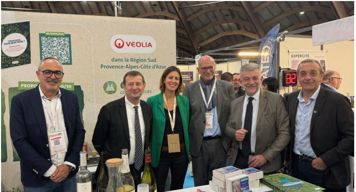
L'AMV sur le stand de Veolia.