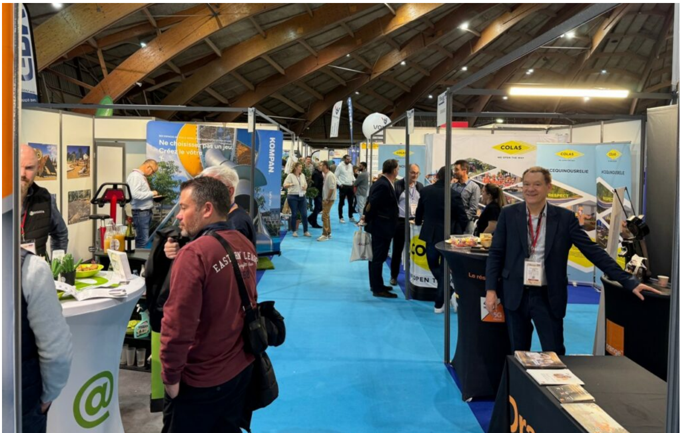
Dans les allées du salon.

« Nous sommes dans un contexte des plus tendus en ce qui concerne la question des finances locales, confirme le président de l'AMV. Nous savons que la recherche de co-financements pour les projets ne sera pas des plus simples. L'incertitude demeure sur le montant des fonds d'Etat, Fond vert, DSIL... De plus, nos budgets sont tributaires d'éléments extérieurs. Le ralentissement immobilier génère deux conséquences : la baisse des DMTO (Droits de mutation à titre onéreux) avec la difficulté de programmer le montant dans les préparations budgétaires ainsi que la perception de la Taxe d'aménagement. »