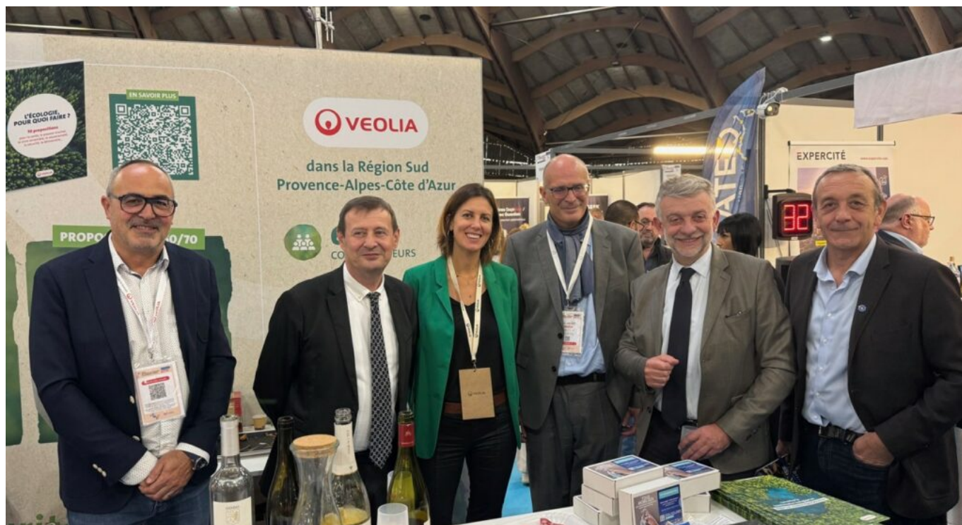
L'AMV sur le stand de Veolia.