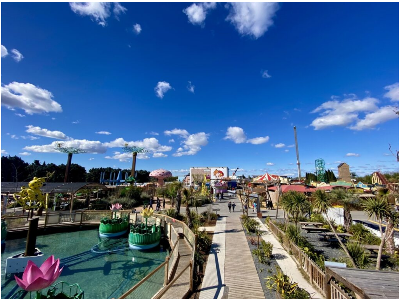
Vue d'ensemble du parc depuis la jungle tropicale des marsupilamis.

Pour se faire, la direction souhaite investir encore 18 millions d'euros sur les 4 prochaines années. Ce plan a plusieurs objectifs, non seulement pour le parc en lui-même, mais également pour le territoire dans lequel il se trouve : favoriser le recrutement dans le département, mais également faire du Vaucluse une destination davantage attractive pour les Français et les étrangers. Si la crise du Covid-19 a eu un certain impact sur l'affluence du parc qui n'a accueilli que 220 000 visiteurs en 2021, la direction vise 50 000 de plus cette saison grâce à la levée des restrictions, et davantage sur les années à venir.