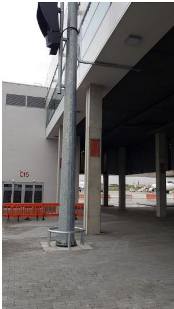
Budapest Hongrie : poteaux pour systèmes de guidage visuel d'amarrage aéroportuaire.