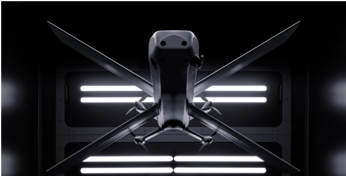
Le drone HX-2 de Helsing.

« Offrir à nos armées un avantage décisif et fiable. »