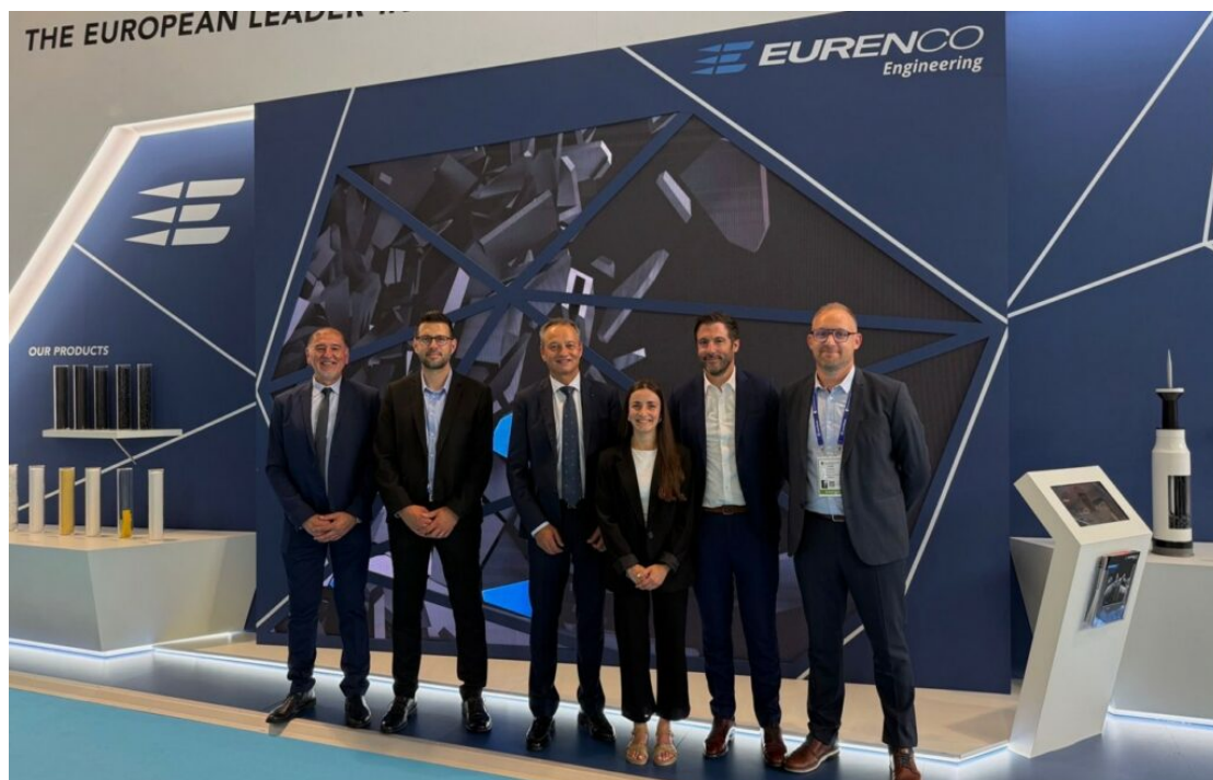
Le stand d'Eurengo Engineering lors de la dernière édition d'Eurosatory.