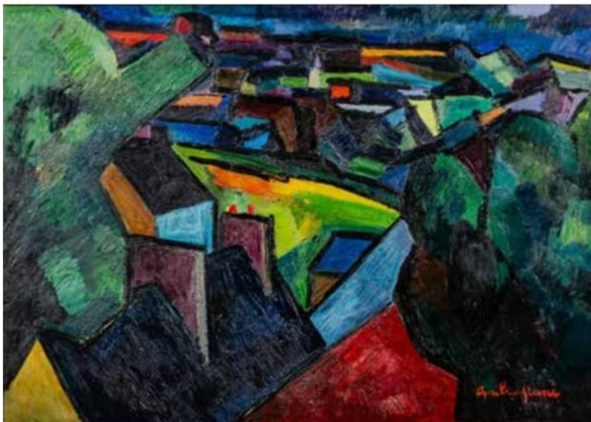
Paysage de Pierre Ambrogiani

Samedi 1er Novembre : Véhicules de collection de M. J-M Graille ; Mercredi 5 Novembre : Bijoux & Or ; Samedi 15 Novembre : Grands Vins & Alcools ; Samedi 22 Novembre : Joaillerie et Montres de Collection ; Samedi 6 Décembre : Tableaux Anciens, Mobilier et Objets d'Art ; Mercredi 10 Décembre : Bijoux & Or ; Vendredi 12 Décembre : Armes & Militaria ; Samedi 24 Janvier 2026 : Livres & Autographes.