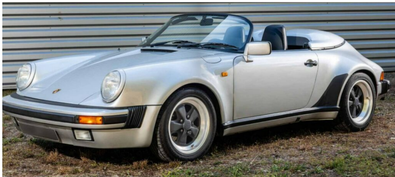
Porsche 911 Carrera