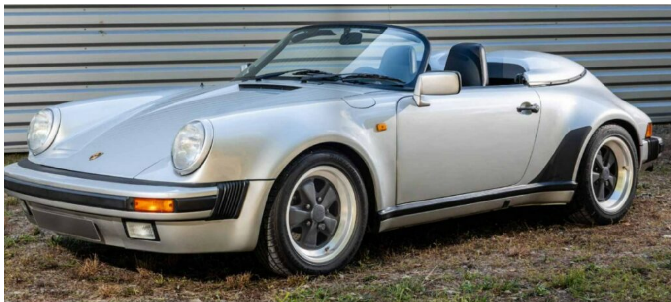
Porsche 911 Carrera