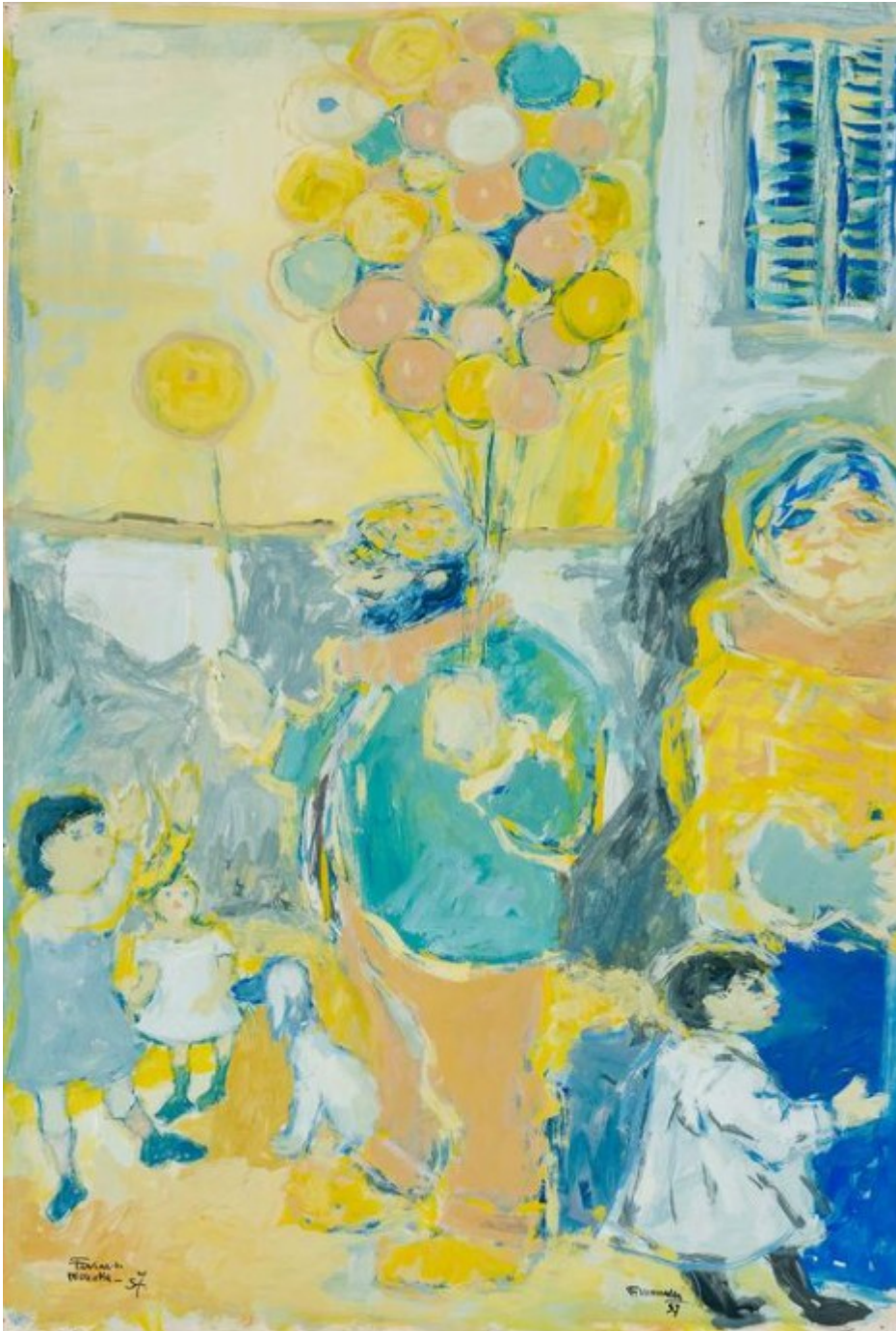
Fikert Moualla, le vendeur de ballons