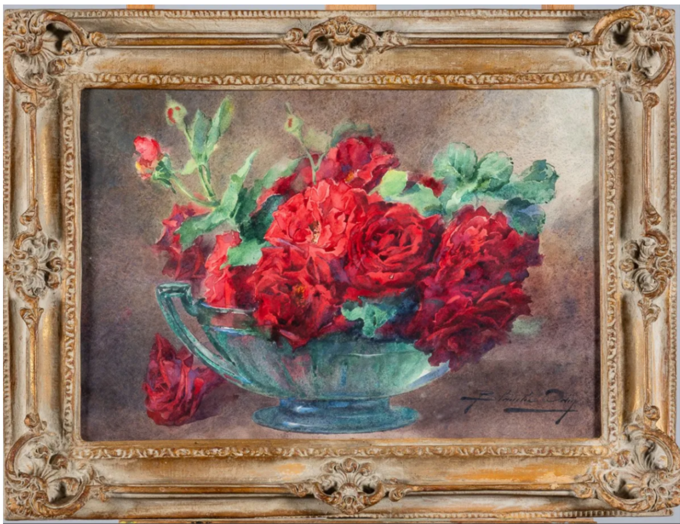
Bouquet de roses

d'air salin et vivifiant voici que paraît le bord de mer et côte rocheuses, une huile sur toile de Paul Elie Gernez (1888-1948) datée de 1917 à partir d'entre 1 500 et 2 000€. Enfin, pour sa touche de couleur et sa belle expression, on pourrait presque sentir les fragrances de cette nature morte au bouquet de roses, une aquarelle signée Blanche Odin (1865-1957) estimée à partir d'entre 1 000 et 1 500€.