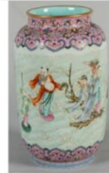
CHINE - XIXe siècle : Vase rouleau en porcelaine à décor émaillé