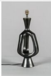
Georges JOUVE (1910-1964) : Rare et important pied de lampe de f