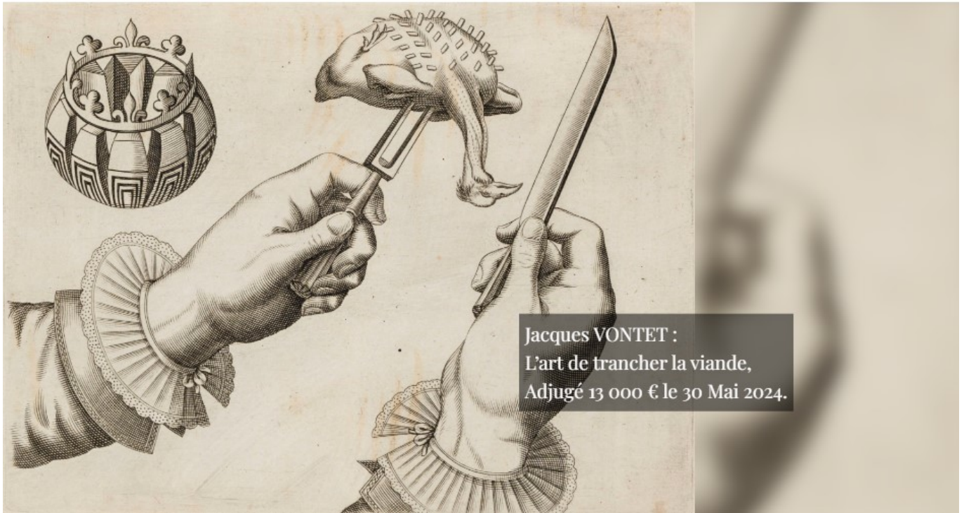
Jacques VONTET : L'art de trancher la viande, Adjugé 13 000 € le 30 Mai 2024.

Hôtel des ventes d'Avignon. 2, rue mère Teresa à Avignon. Fermé jusqu'à jeudi 29 août à 9h. Expertise sans rendez-vous tous les mardis de 9h à 12h et de 14h à 17h. Reprises aux horaires : du lundi au vendredi 10h-12h, 14h-17h. Mardi-jeudi : 9h-12h, 14h-18h. Mercredi 9h-12h. 04 90 86 35 35 contact@avignon-encheres.com