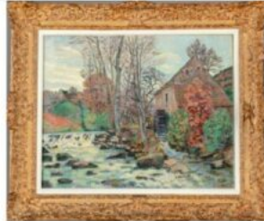
Armand GUILLAUMIN (1841-1927) : Moulin Charraut (dit Bouchardon). Huile sur toile signée en bas à droite, titrée sur le châssis et numérotée 21314. Dim. : 65,5x71 cm....