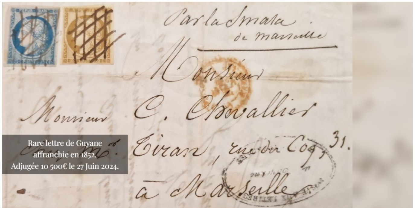
Rare lettre de Guyane affranchie en 1852. Adjugée 10 500€ le 27 Juin 2024.