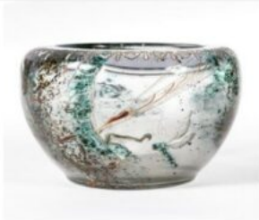
Emile GALLE (1846-1904) : " Les anisoptères " 1882. Rare et exceptionnelle coupe balustre évasée à large col annulaire rentrant. Epreuve en cristal soufflé au riche décor...