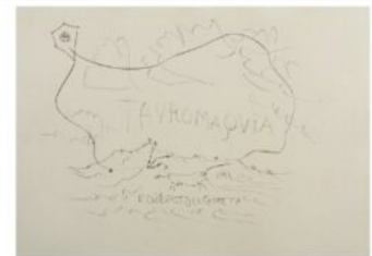
Pablo PICASSO (1881-1973): Jose DELGADO alias Pepe Illo - LA TAUROMAQUIA