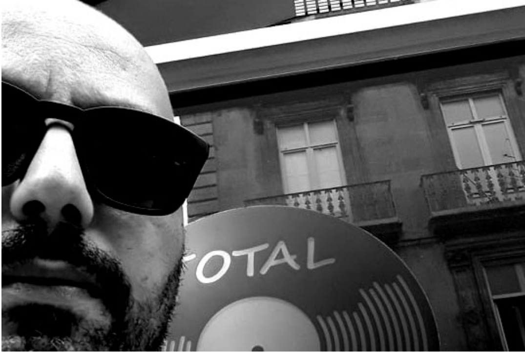
Nacime B © DR.

Pour écouter Nacime B, cliquez sur ce lien .