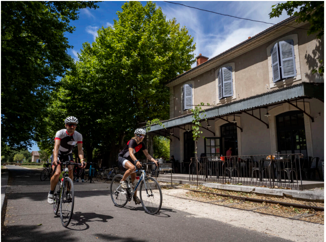
Gare de Loriol-du-Comtat sur la Via Venaissia

L'évolution du nombre de loueurs de vélos est également un autre indicateur intéressant. Leur nombre est passé de 10 à 20 en quelques années. Le réseau de professionnels affilié à l'association Vélo Loisir Provence, compte aujourd'hui, 56 hébergeurs, 20 loueurs, 8 restaurants, 8 caves, 5 accompagnateurs, 5 agences de voyages et 3 transporteurs. Certains bâtiments comme les anciennes gares SNCF de la vélo route du Calavon sont transformées en restaurants ou en lieux d'exposition culturel. C'est tout un éco système qui est en train de se constituer autour du vélo.