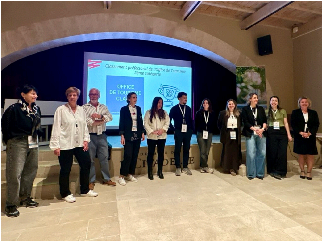
L'équipe de l'office de tourisme.