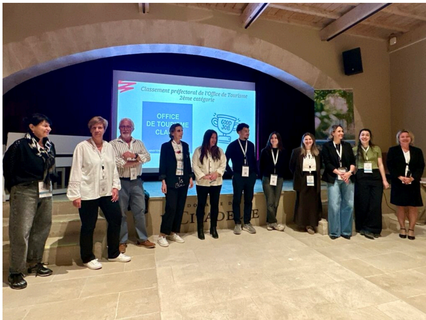
L'équipe de l'office de tourisme.