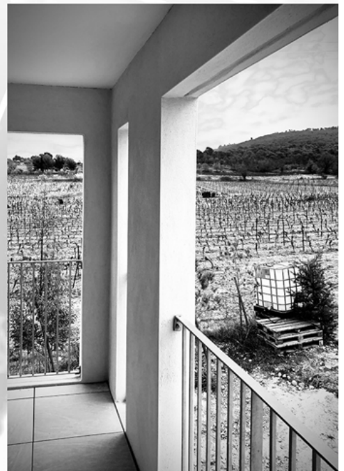
Maître d'ouvrage : Vallis Habitat / Maître d'œuvre : 28.04 architecture / Mars 2021.