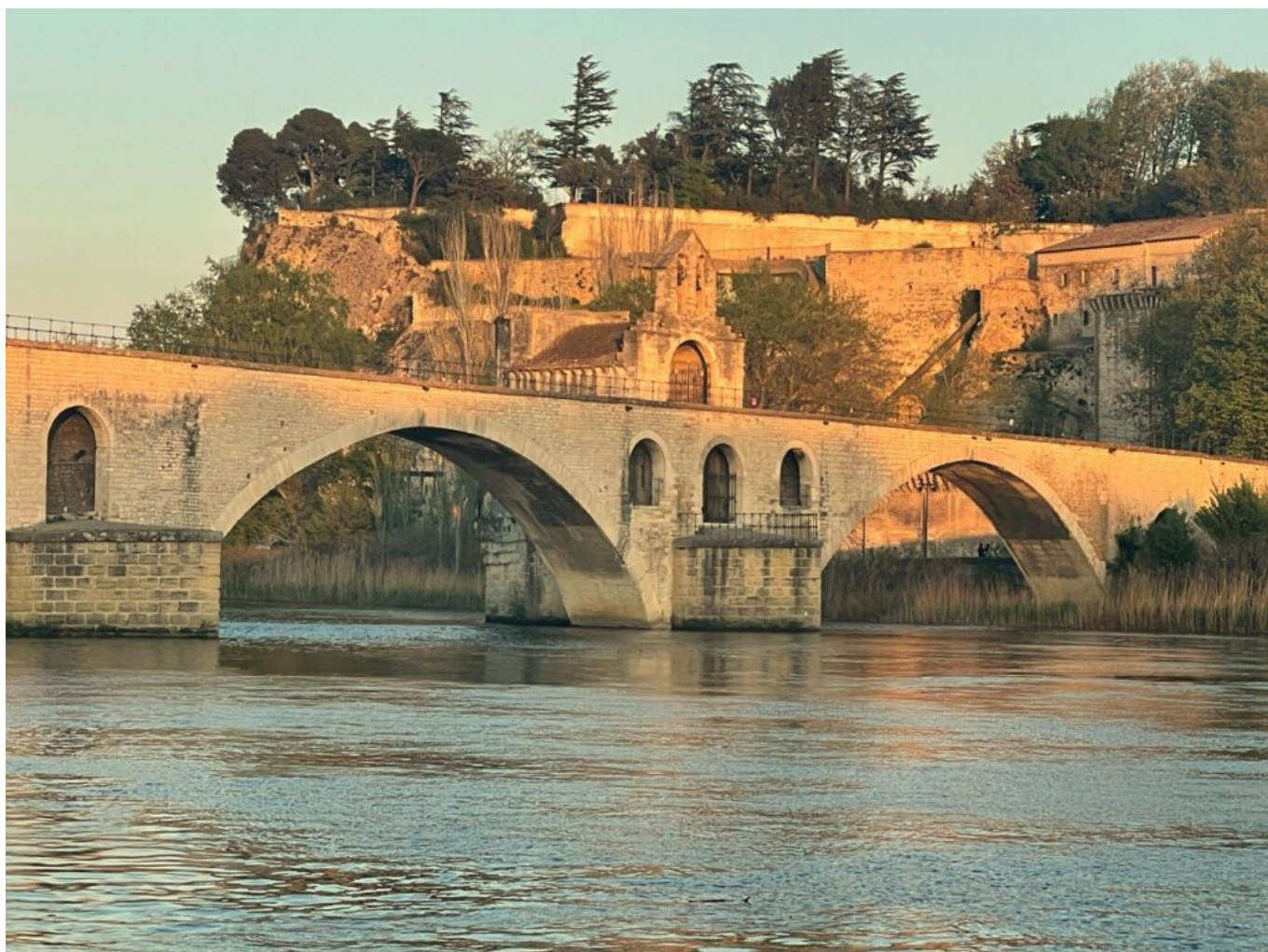
Le Pont Saint Bénézet