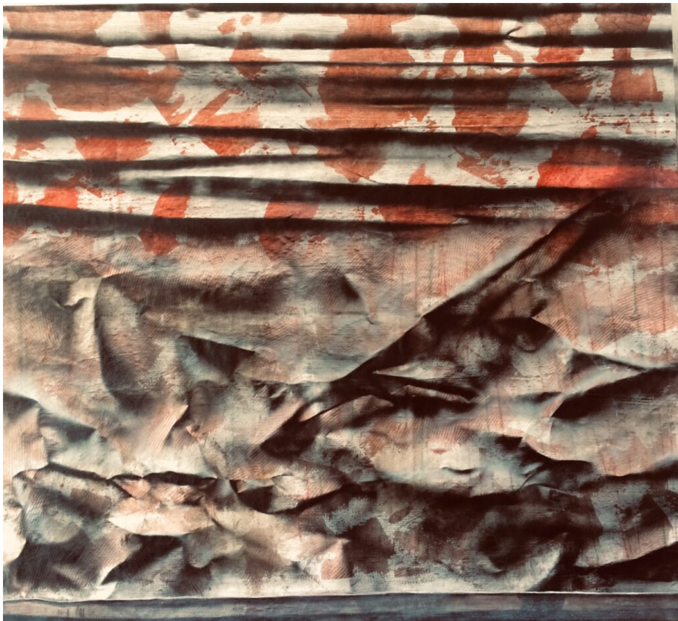
Contrainte obligée III (126X114) © Yvan Magnani

Du 18 août au 7 septembre, à la Chapelle des Pénitents Blancs, Saint-Martin-de-Castillon.