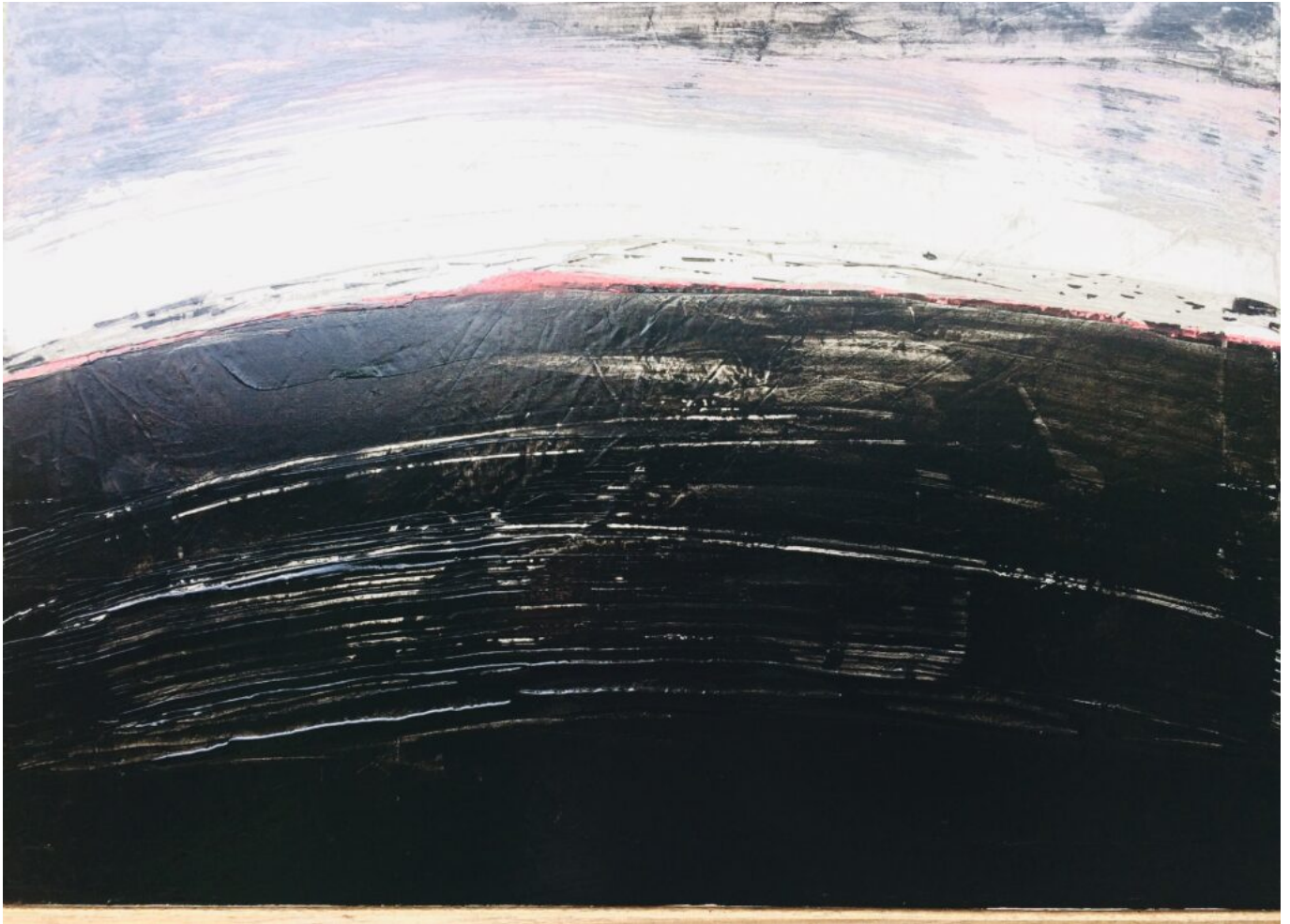
Autoclave II (92X65) © Yvan Magnani