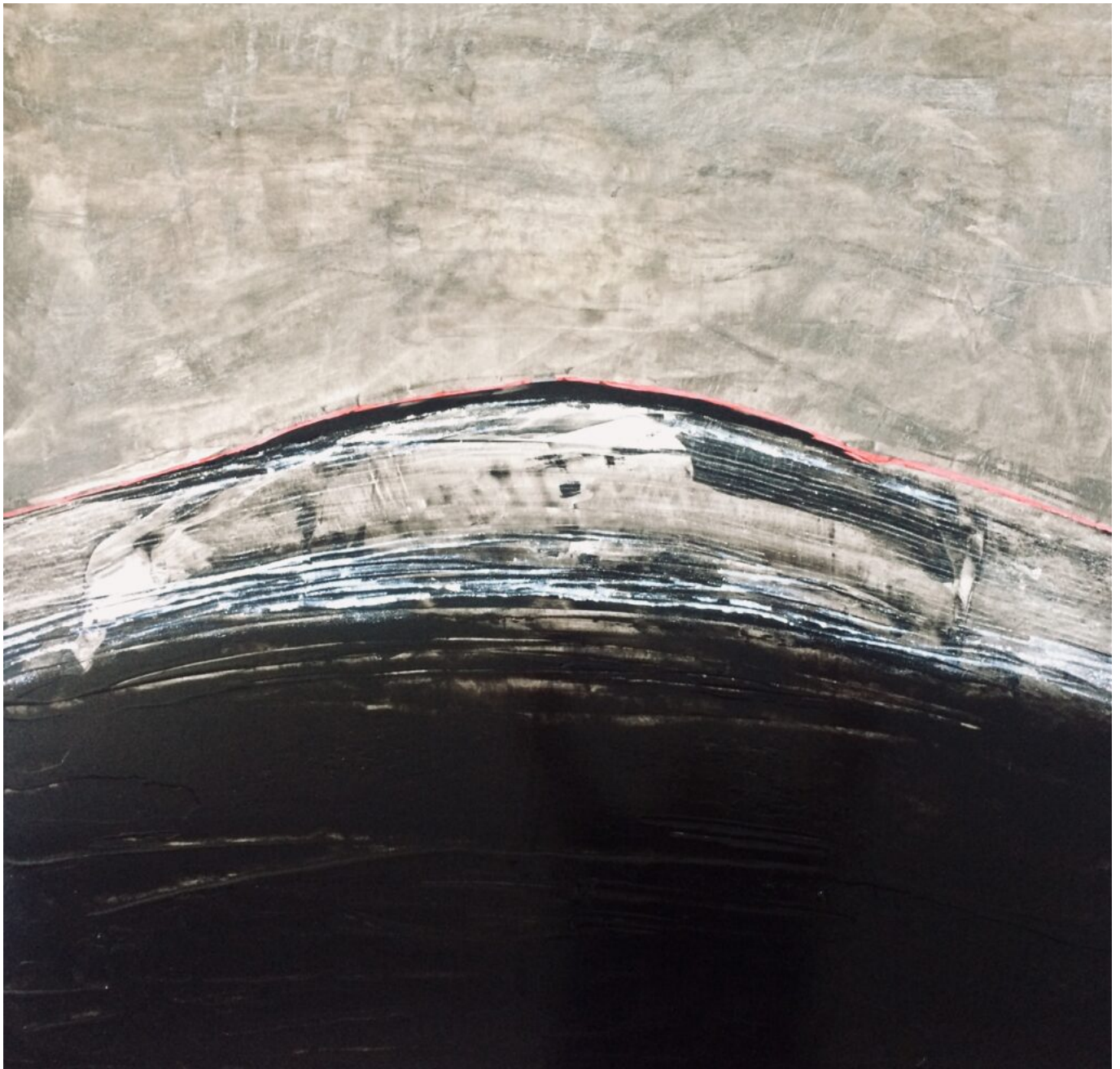
Autoclave I (90X90) © Yvan Magnani