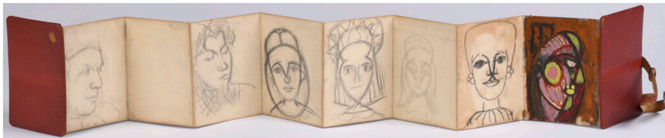
Un carnet de Dora Maar ©Luc Pâris